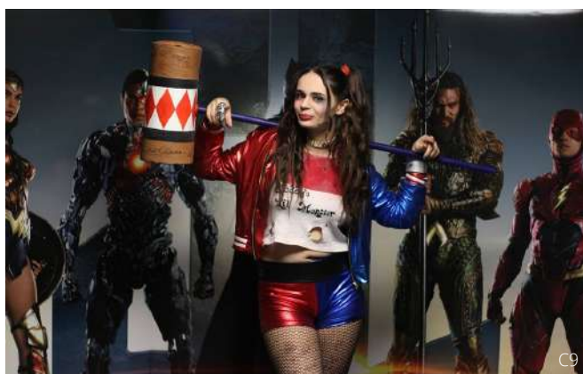
Photo Booth au cinéma CGR de Troyes (10) à l'occasion de la sortie du film "Justice League".