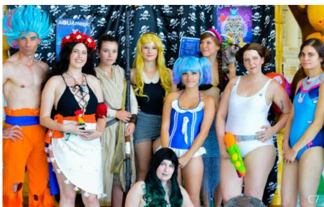
Animation à la piscine municipale de Tomblaine (54). L'objectif était de passer un bon moment avec les enfants et les familles de la ville.