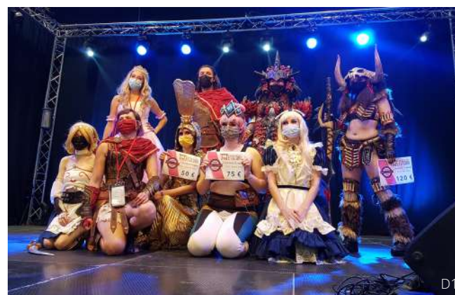
Organisation du concours et du défilé cosplay de Metz'torii (54). Photo des gagnants et jury.