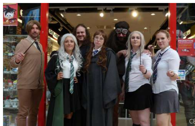
Déambulation et ateliers pour la boutique "Shop for Geek" dans la galerie Auchan de Semécourt (57). L'animation avait pour thème "Harry Potter".