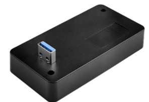
Lecteur NFC (uniquement pour EVOLVE)