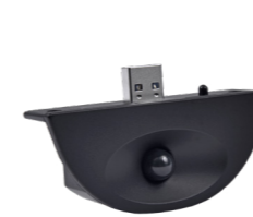
Détecteur de présence (uniquement pour EVOLVE)