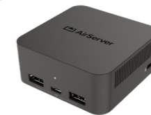
AirServer Connect 3