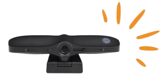
Caméra JPL Spitfire