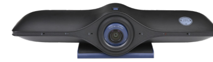
Caméra JPL Agora