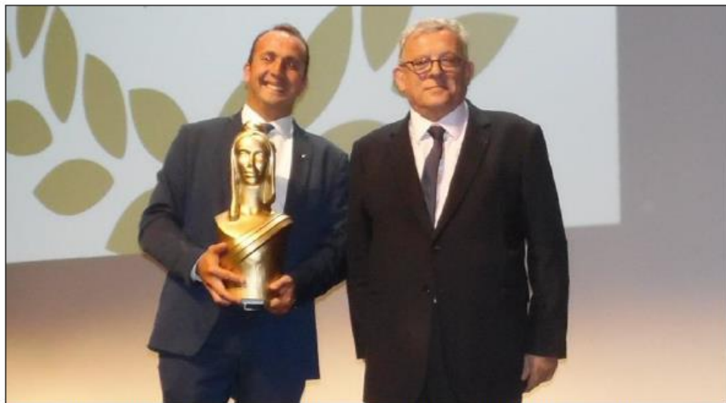
■ En juillet, la commune s'est vue remettre une Marianne d'or pour le dispositif de Solidarité réciproque.