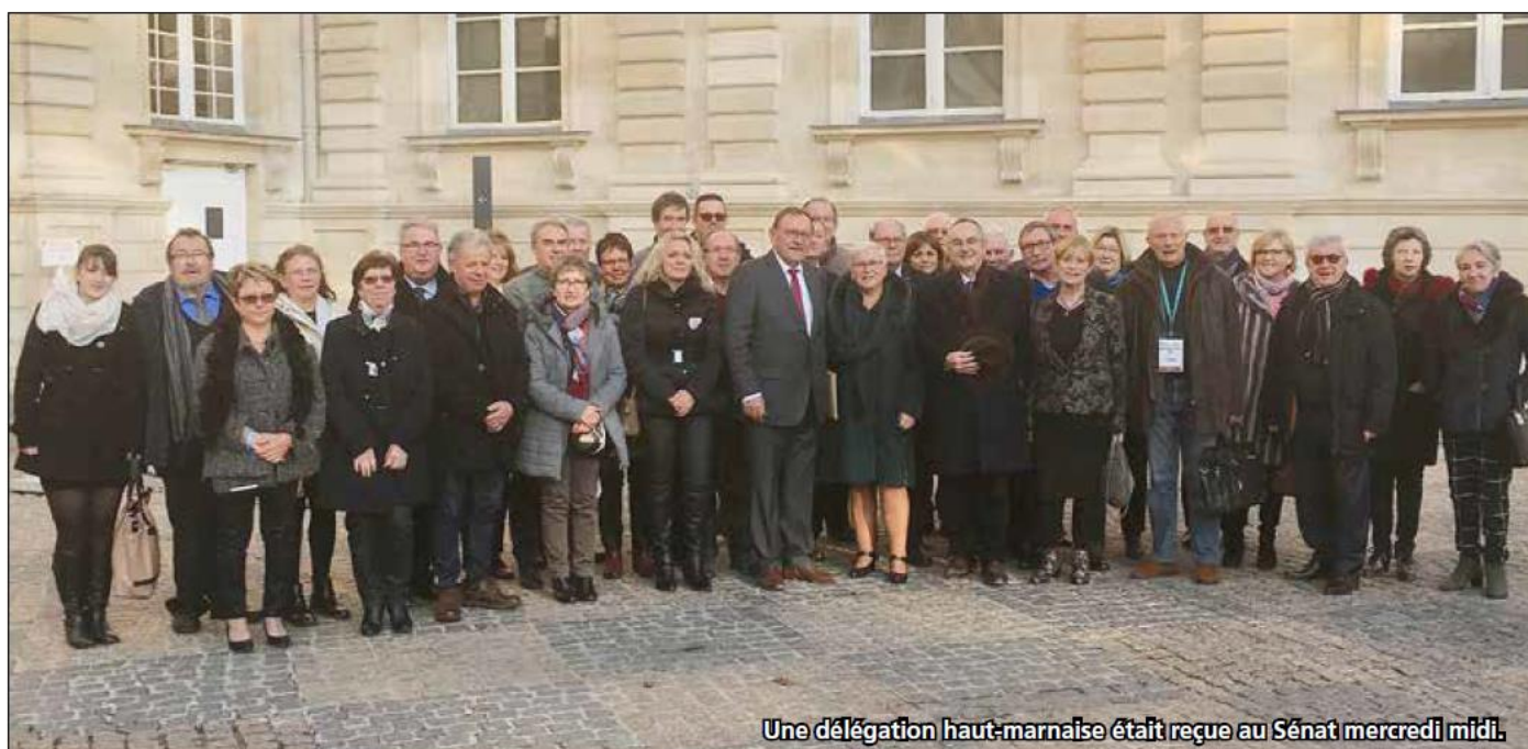
Une délégation haut-marnaise était reçue au Sénat mercredi midi.

Une quarantaine d'élus haut-marnais se sont rendus au Salon des maires ainsi qu'au congrès, à Paris, en début de semaine. De mardi matin à jeudi soir, leur programme a été pour le moins chargé. Après