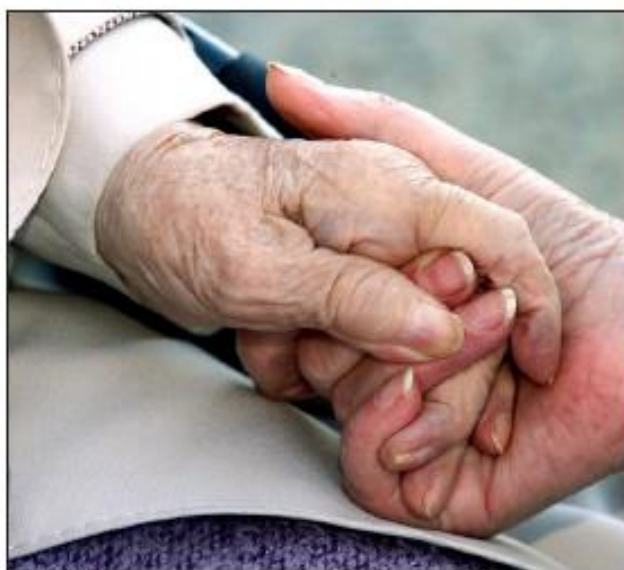
■ Les bénéficiaires peuvent faire du bénévolat auprès de personnes âgées ou auprès d'enfants.