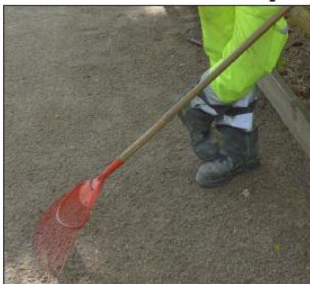
■ Une des personnes qui participe au dispositif entretient le terrain de pétanque.

Après avoir connu des situations difficiles et avoir reçu de l'aide, ils désherpent les terrains de boules ou participent bénévolement aux animations de la commune. Un lien habitants mairie qui a un nom : la solidarité réciproque.