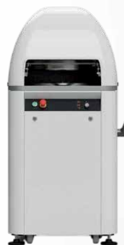
Diviseuse bouleuse semi automatique