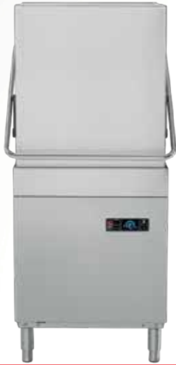
Lave-vaisselle à capot