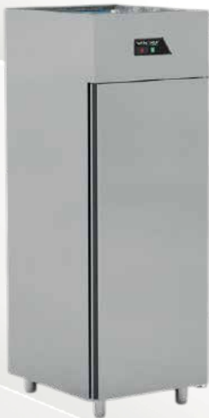
Armoire froid positif