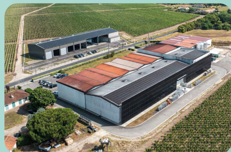
Mur et toiture photovoltaïque avec solution de stockage (33)