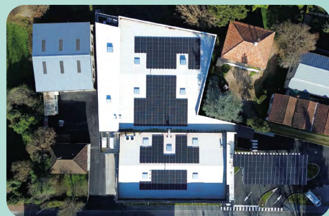
Ombrières et centrale en toiture d'un site Leclerc Drive (24)