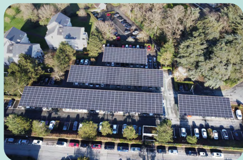
Ombrières et bornes de recharge sur le parking du siège de l'ADEME (49)