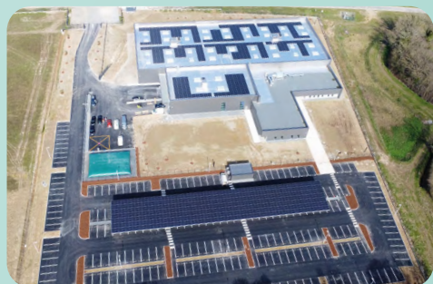
Ombrières et centrale en toiture (35)