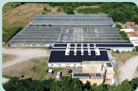
Centrale de 211 kWc en toiture (33)