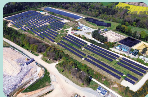
Centrale de 5 MWc sur un site d'enfouissement de déchets (56)