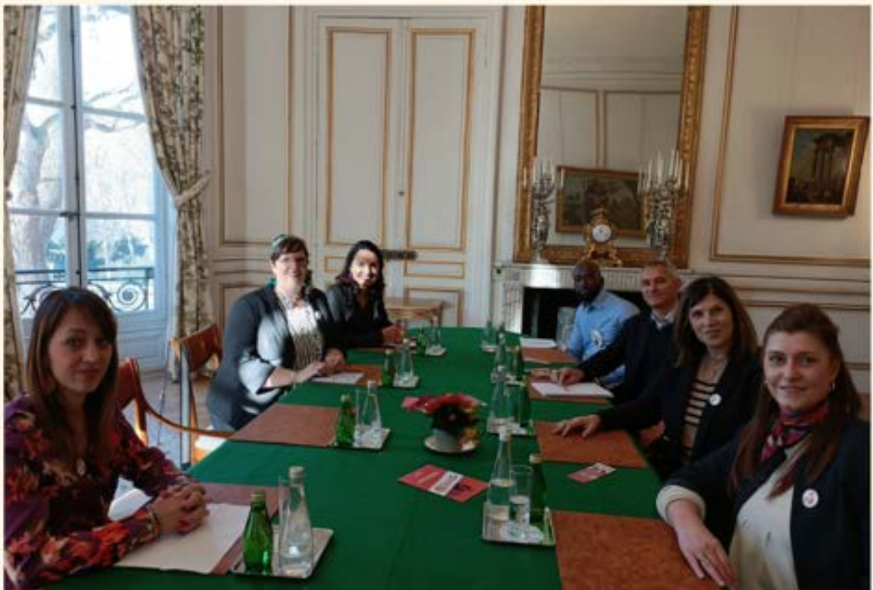
La Niaque l'Asso au Ministère du Travail

La Niaque s'appuie sur un principal constat de départ: "1 personne sur 3 quitte ou perd son emploi dans les 2 ans après avoir eu son diagnostic"