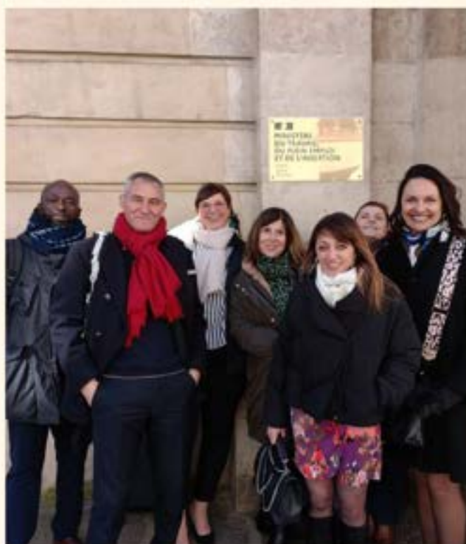
La Niaque l'Asso au Ministère du Travail

▶ Enrichissez votre marque employeur et traduisez en acte votre bienveillance.