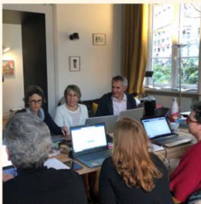
Groupe de Niaqueurs et Niaqueuses lors de leur atelier à Lyon

▶ Sensibilisez vos employé·e·s et vos partenaires à la juste et nécessaire inclusion de toutes et tous à la société et au monde du travail.