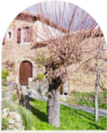
Maison à réhabiliter Ardèche (07)