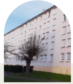
Travaux de copropriété Charente-Maritime (17)

Travaux Quote-part CO2 évités 30k€ 18% 260t