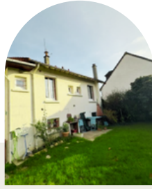
Maison en location à rénover Essonne (91)

Travaux Quote-part CO2 évités 15k€ 31% 310t