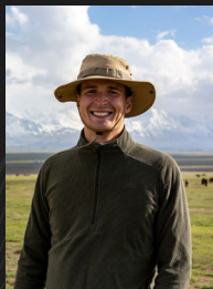
PAUL DUCREY LOGISTIQUE