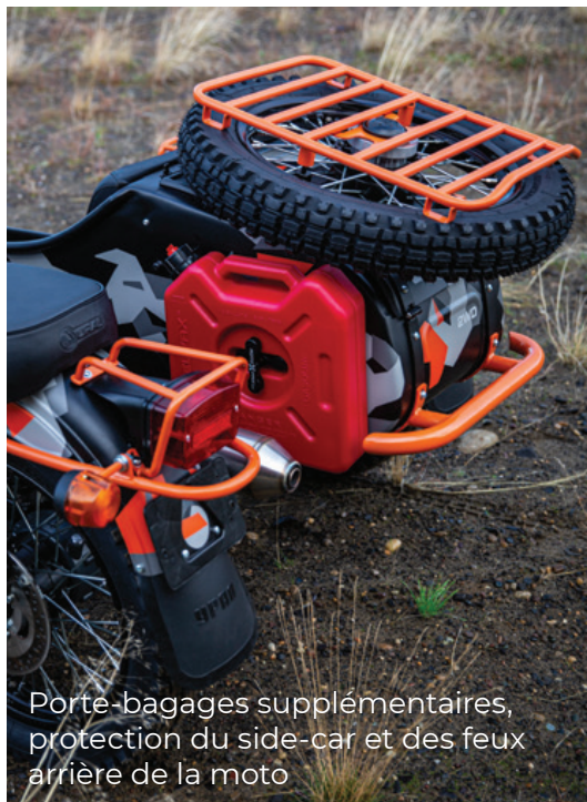
Porte-bagages supplémentaires, protection du side-car et des feux arrière de la moto