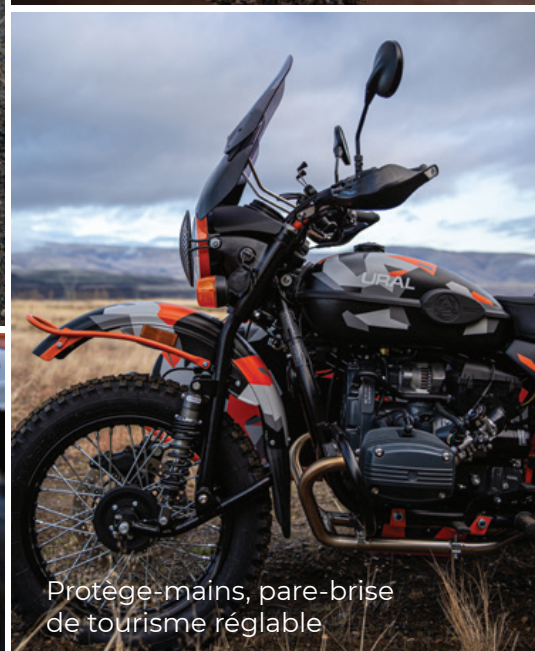
Protège-mains, pare-brise de tourisme réglable