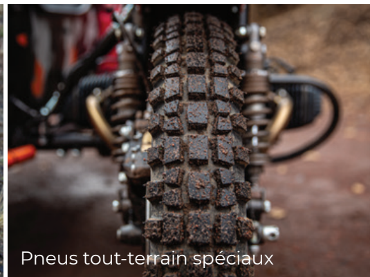
Pneus tout-terrain spéciaux