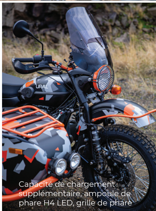
Capacité de chargement supplémentaire, ampoule de phare H4 LED, grille de phare