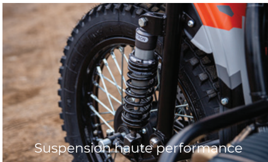
Suspension haute performance