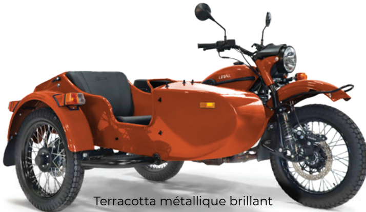
Terracotta métallique brillant

AVEC 8 COULEURS DE SERIE AU CHOIX IL S'AGIRA D'UNE DES DECISIONS DIFFICILES A PRENDRE.