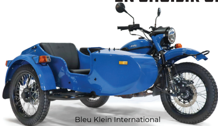
Bleu Klein International

CEPENDANT, VOUS POUVEZ TOUJOURS EN CHOISIR UNE VOUS-MEME, SUR MESURE !