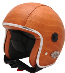
800621-22-23 + Visor