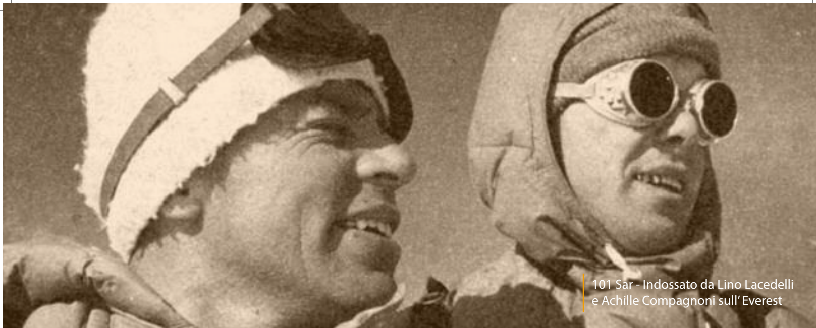
101 Sar - Indossato da Lino Lacedelli e Achille Compagnoni sull' Everest