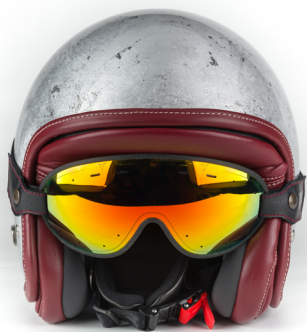
Coordinato con Zar Tebe Argento