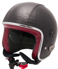
800641-42-43 + Visor