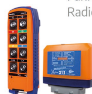
Funkfernsteuerung Radio control