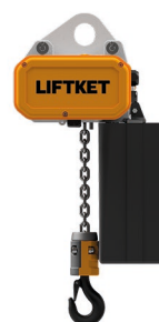
Sonderlackierung Special coating