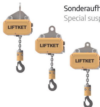
Sonderaufhängeösen Special suspensions