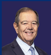
Patrick OLLIER Ancien Ministre, Président de la Métropole du Grand Paris, Maire de Rueil-Malmaison