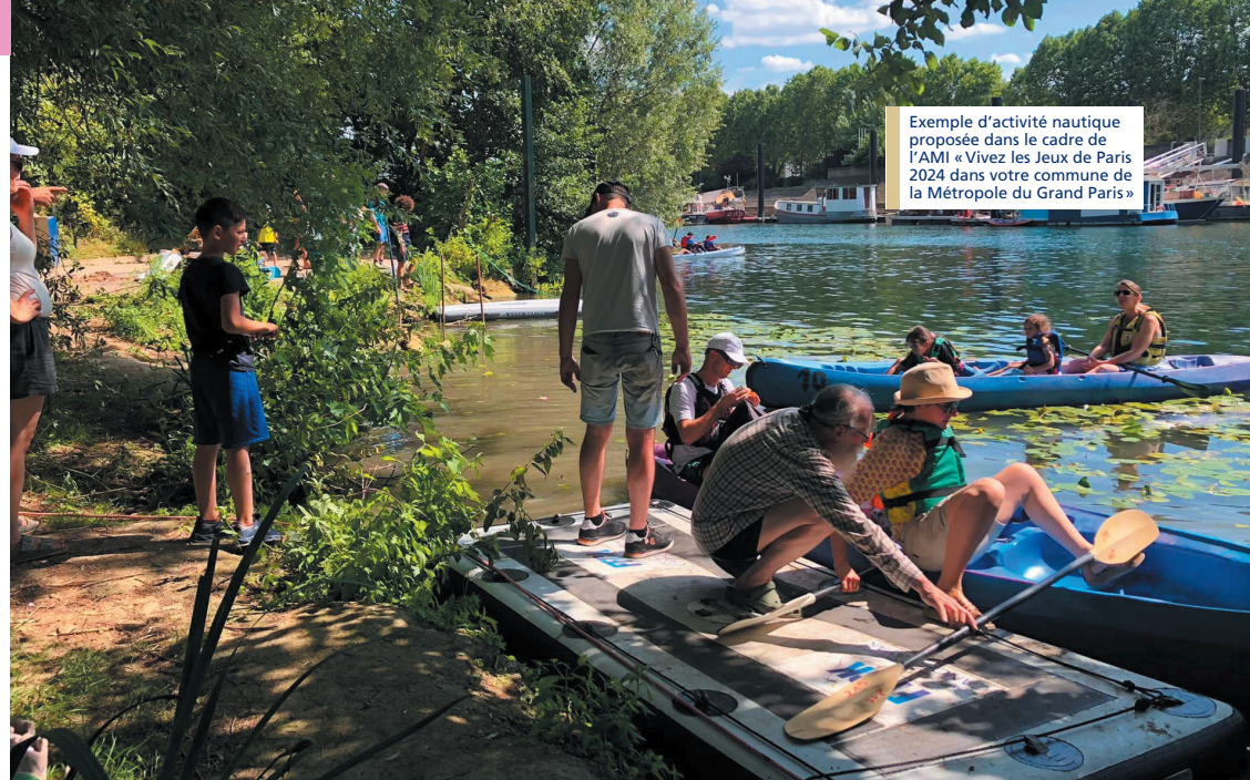
Exemple d'activité nautique proposée dans le cadre de l'AMI «Vivez les Jeux de Paris 2024 dans votre commune de la Métropole du Grand Paris»

Pour contribuer à la réussite locale des Jeux de Paris 2024 et faire en sorte que chaque Métropolitain puisse y prendre part, la Métropole du Grand Paris a lancé son appel à manifestation d'intérêt « Vivez les Jeux de Paris 2024 dans votre commune de la Métropole du Grand Paris » qui vise à soutenir et promouvoir un ensemble d'événements et d'animations proposés par les communes métropolitaines, dans les centres-villes et en bord de cours d'eau.