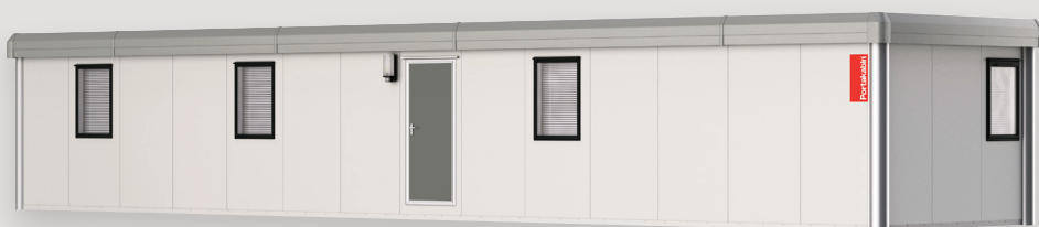
TN184 : 66,61 m 2 Ici configuré en bureaux