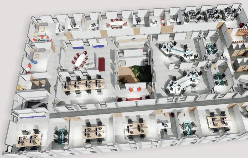
Module Alta : 1518 m 2 Ici configuré en bureaux et salles de réunion