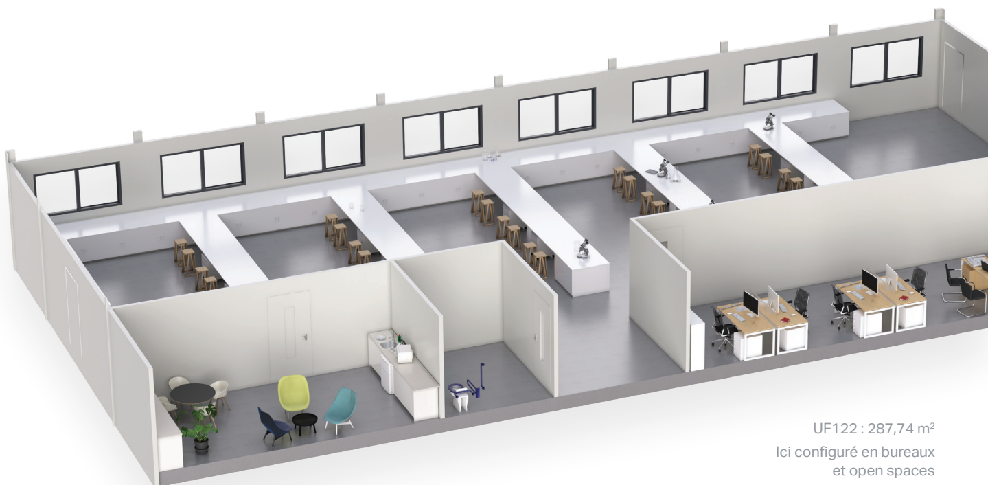
UF122 : 287,74 m 2 Ici configuré en bureaux et open spaces