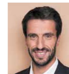
Tony ESTANGUET Président de Paris 2024

En tant que maître d’ouvrage, la Métropole, à l’issue des Jeux Olympiques et Paralympiques de Paris 2024, va ainsi laisser en héritage à la Ville de Saint-Denis, au Département de la Seine-Saint-Denis et à l’ensemble de la Métropole, un Centre Aquatique Olympique d’une grande modernité, avec 4 bassins de dimensions différentes dont un de dimension variable, qui va pouvoir accueillir en résidence l’équipe de France de plongeon (FFN), et d’une modernité exemplaire permettant d’accueillir, en instantané, 3 850 personnes, des scolaires aux plus grands compétiteurs.