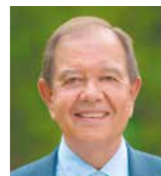
Patrick OLLIER Ancien Ministre, Président de la Métropole du Grand Paris

“ L’immense fierté qui est celle aujourd’hui de la Métropole du Grand Paris est certes, d’être partie de rien, mais d’avoir relevé cet immense défi qui n’a été possible qu’avec le concours de l’Etat, de la SOLIDEO, du groupement d’entreprises mené par Bouygues Bâtiments Île-de-France, et des équipes de la Métropole du Grand Paris.