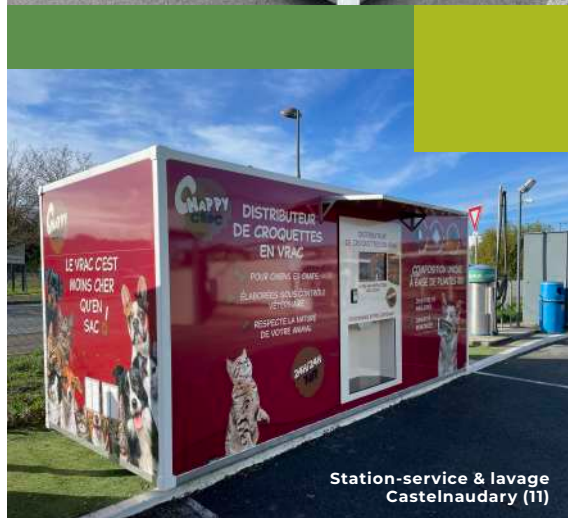
Station-service & lavage Castelnaudary (11)