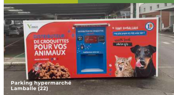
Parking hypermarché Lamballe (22)