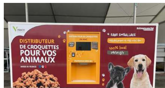
Parking supermarché Pontivy (56)