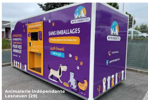
Animalerie indépendante Lesneven (29)