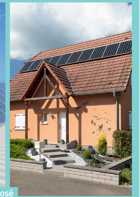
Sur mon toit, plat ou en pente, en intégré ou surimposé

ÉS s'efforce de trouver, pour chaque site, la solution qui combine performance, esthétique et praticité. En toiture, au sol, en terrasse, tout est envisageable !