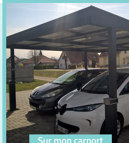
Sur mon carport

ÉS s'efforce de trouver, pour chaque site, la solution qui combine performance, esthétique et praticité. En toiture, au sol, en terrasse, tout est envisageable !