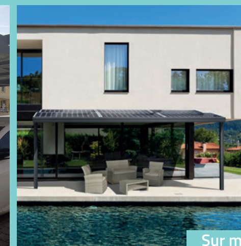
Sur ma terrasse