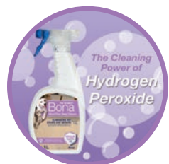
SOLUTION À L'OXYGÈNE ACTIF pour un nettoyage en profondeur