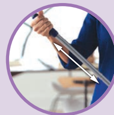
MANCHE TÉLESCOPIQUE réglable à la hauteur souhaitée

Le balai Bona Pet System est la solution de nettoyage ultime pour les propriétaires d'animaux de compagnie. Ce balai léger et solide est livré avec deux pads en microfibre, chacun conçu spécifiquement pour le nettoyage des petites surprises laissées par nos amis à quatre pattes.