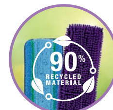
PADS FABRIQUÉS À PARTIR DE 90 % DE MATÉRIAUX RECYCLÉS ET LAVABLES JUSQU'À 500 FOIS