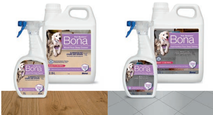
Nettoyant en profondeur pour parquets

Faites votre choix parmi nos formules pour parquets ou sols durs.