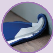
COINS SOUPLES ET ARRONDIS pour protéger les meubles et les plinthes