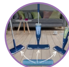
PADS COMPATIBLES AVEC TOUS LES BALAIS BONA