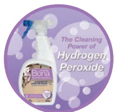
SOLUTION À L'OXYGÈNE ACTIF pour un nettoyage en profondeur