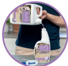
RECHARGES ÉCONOMIQUES pour tous les flacons de nettoyant Bona