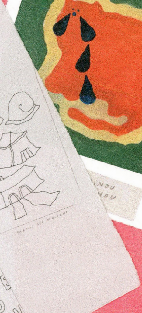
FRANCIS LES MALTOISE