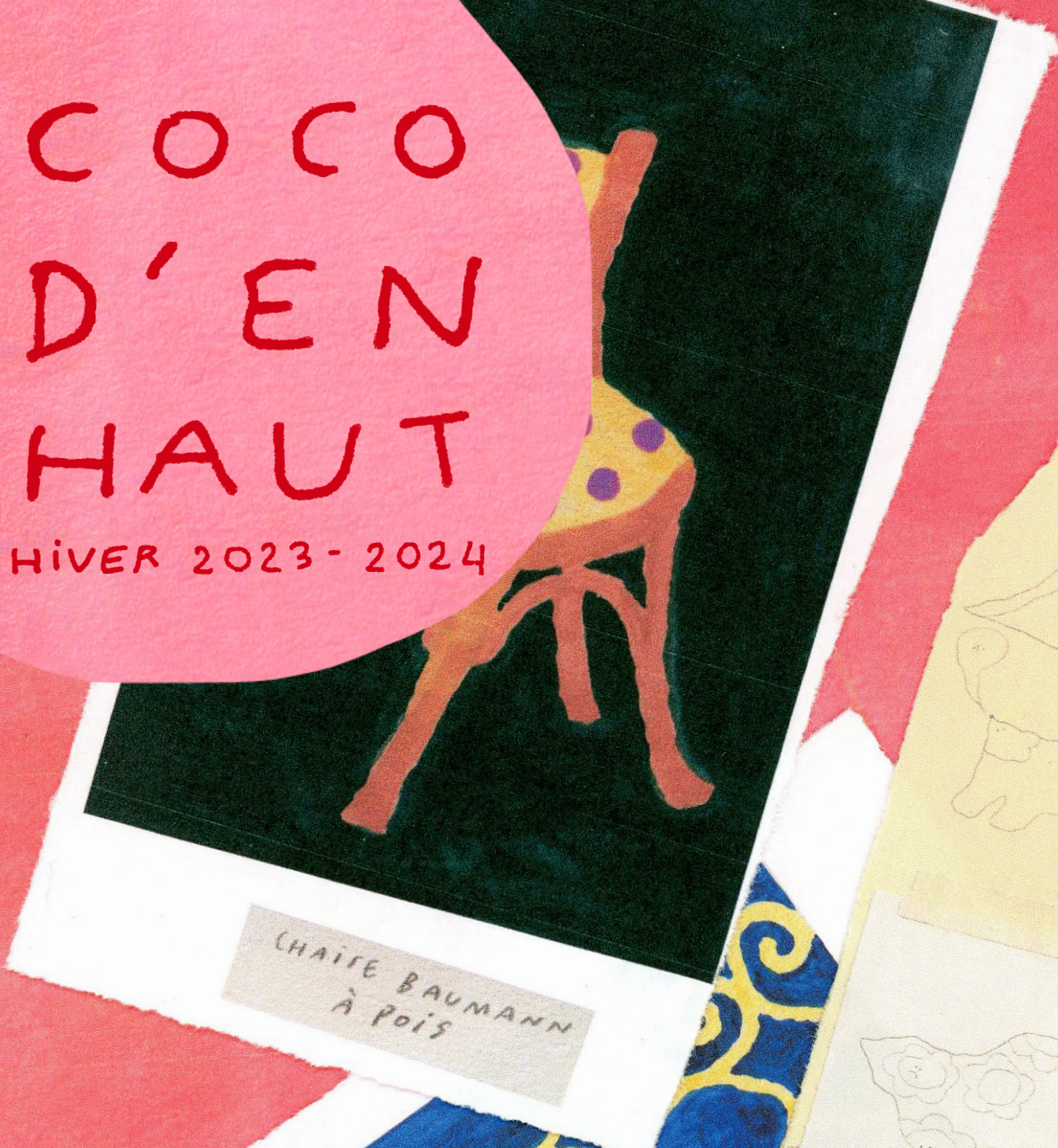
CHAIRE BAUMANN À POIS