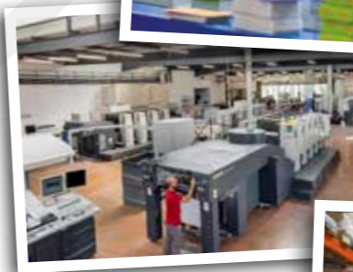
Impression des planches de cartes