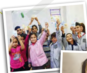
Distribution des jeux par l'ONG Tahaddi.