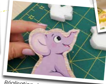
Réalisation de prototypes