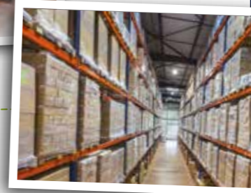
Stockage et logistique