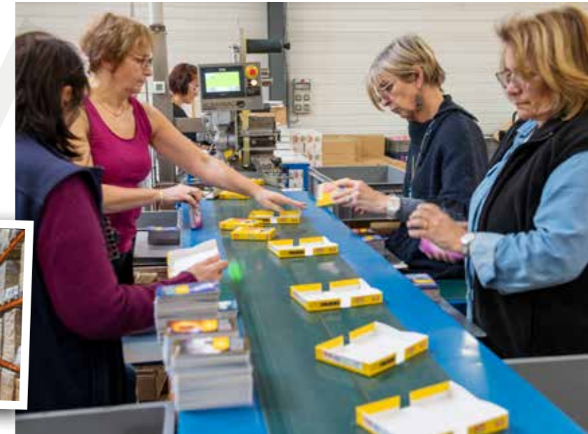
Lignes d'assemblage des boîtes de jeux