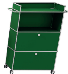
Banque mobile / point d'information