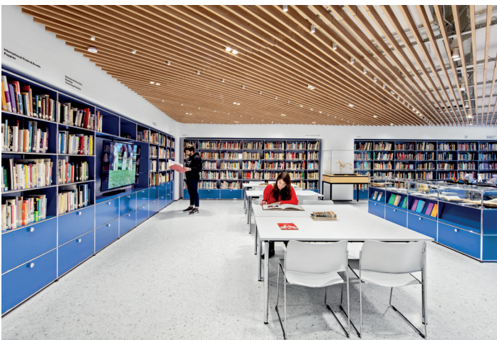
AKC Museum of the Dog (US)