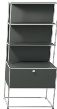
Etagère avec module de rangement intégré