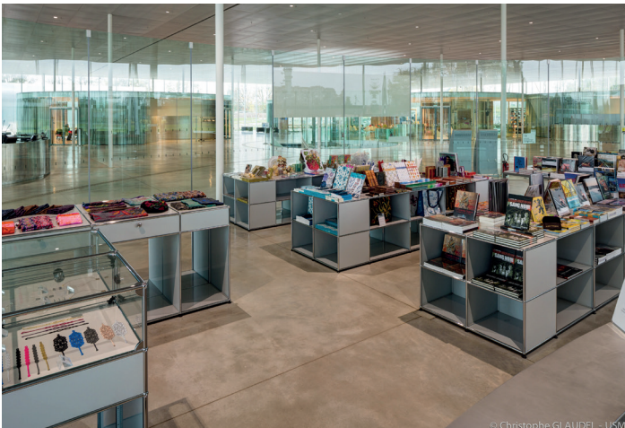
Musée du Louvre-Lens (FR)