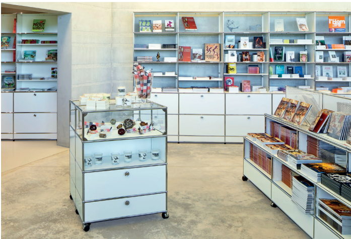
Lascaux - Centre international de l'Art Parietal (FR)