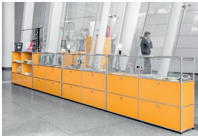
Brooklyn Museum (US)