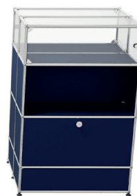
Meuble vitrine avec modules de rangement