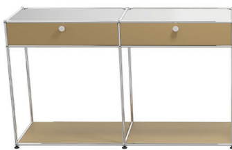
Console de présentation