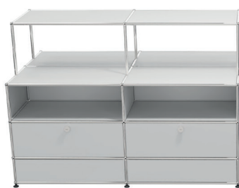
Meuble îlot avec podium