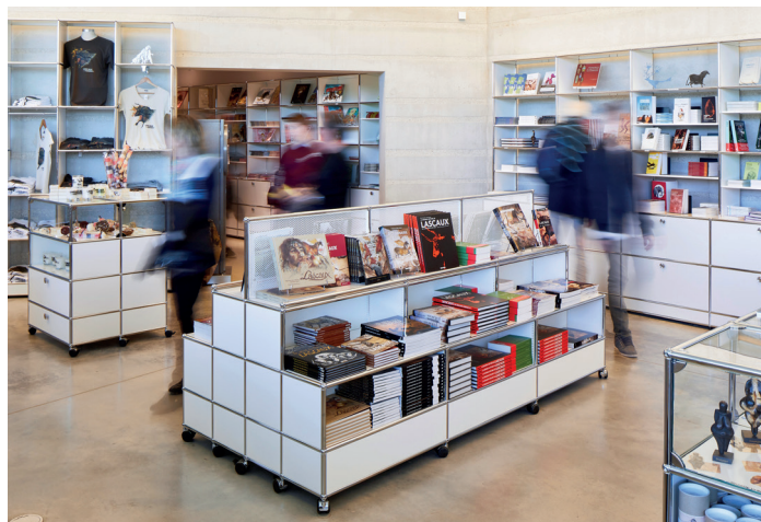
Lascaux - Centre international de l'Art Parietal (FR)