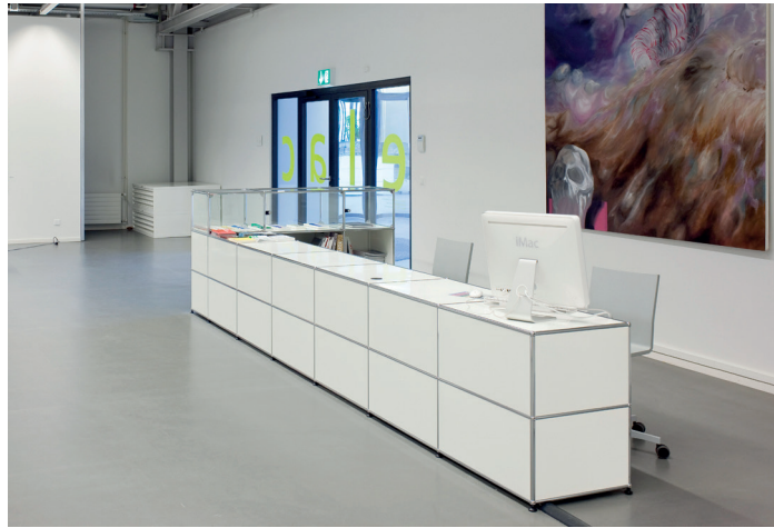
Galerie de L'ECAL (CH)