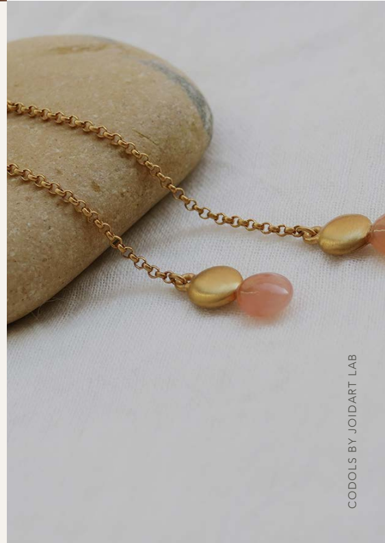
CODOLS BY JOIDART LAB