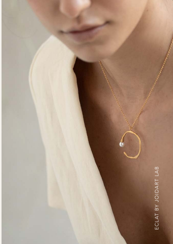
ECLAT BY JOIDART LAB

Nous puisons notre inspiration à la source de notre mer et de notre terre d'artistes célèbres. Nous saisissons l'art au cœur de notre culture et de notre nature méditerranéenne pour les transformer en créations minimalistes et intemporelles avec les artistes et bijoutières émergentes qui nous entourent.