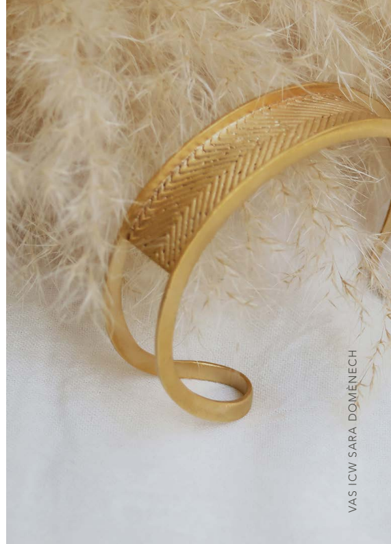
VAS ICW SARA DOMÉNECH