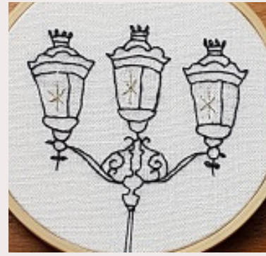
LAMPADAIRE PARISIAN LIGHTS