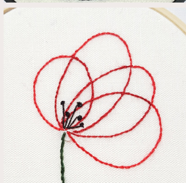
TRIO COQUELICOT POPPY TRIO