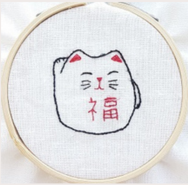
MANEKI NEKO MANEKI NEKO