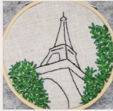
TOUR EIFFEL EIFFEL TOWER