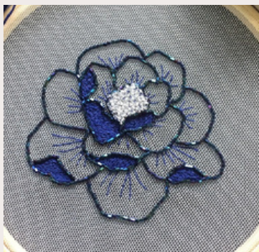
FLEUR BLEU NUIT NIGHT BLUE FLOWER

Prices are in euro before VAT, per unit and before cost of delivery (calculated at the order)