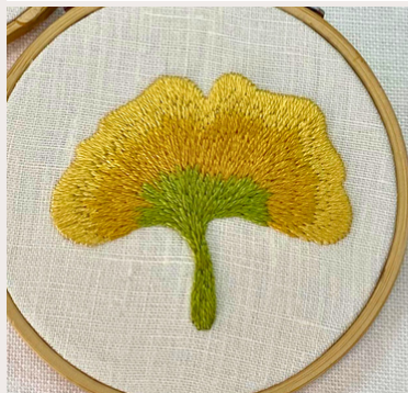
TRIO BEAUX JOURS SPRING TRIO