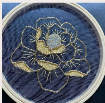
FLEUR OR GOLDEN FLOWER