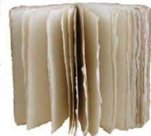
embossage impression au cadre dorure à chaud personnalisation