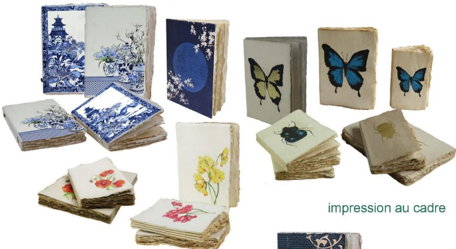
impression au cadre