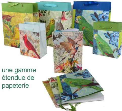
une gamme étendue de papeterie