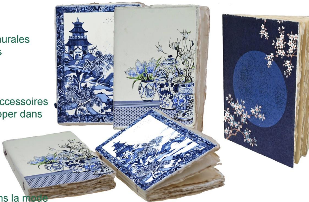
Collection Carnet japonais, papier parchemin réalisé à la cuve à partir de chutes de coton, traité pour recevoir tout type d'encre. format A6 et A5, 96 pages

Le dénominateur commun aux collections est le sens des matières et la vibration par les couleurs