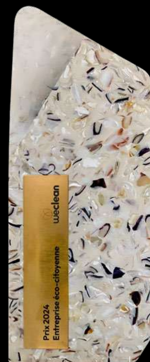
Trophée éco-citoyen fabriqué en coquillages recyclés.

L'ensemble de ses actions mène à l'obtention d'un trophée éco-citoyen.