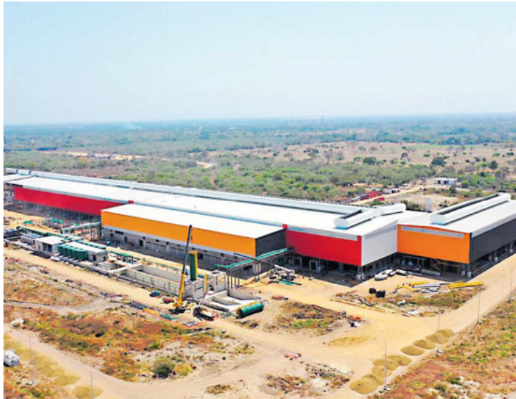
Planta de Ternium ubicada en Palmar de Varela.

Aunque la CEO trabaja para el desarrollo empresarial del área metropolitana de Barranquilla, los tres municipios citados destacan por gestar una “gran oportunidad de consolidación industrial”. Según cálculos del gremio, el 71% de las empresas fuera de Barranquilla se encuentra