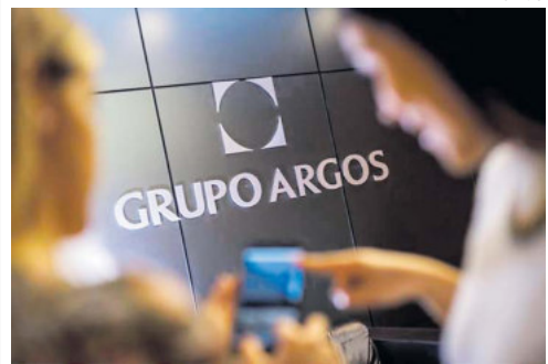
Los ingresos acumulados suman $10,4 billones.

mil millones fue la utilidad neta del Grupo Argos en el tercer trimestre del 2020, que evidencia avances de la reactivación económica.