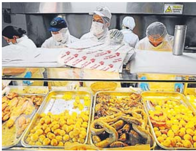
Participan 23 restaurantes, algunos en plazas de mercado.

El anillo y el trofeo que recibió Bench por ganar la Serie Mundial de 1976 se vendieron en 146.875 dólares cada uno. Su anillo de la Serie Mundial de 1975 alcanzó 135.125. El trofeo del título de la "Gran Máquina Roja", 88.125 dólares.