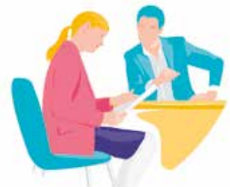
Accompagnement personnalisé vers l'emploi