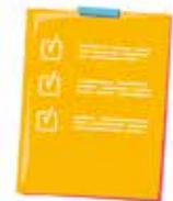
Séances de révision