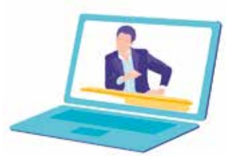
Cours en direct LIVE et ON DEMAND