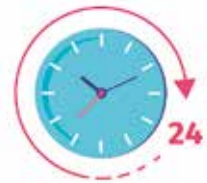
Réponses à vos questions, par nos formateurs, sous 24h ouvrées maximum