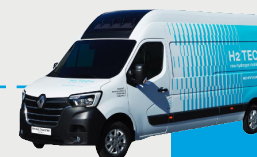
RENAULT MASTER VAN H2-TECH HYVIA Autonomie : 500 km