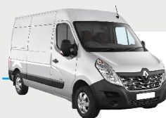
RÉTROFIT RENAULT MASTER Autonomie : 300 ou 600 km