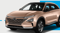
HYUNDAI NEXO Autonomie : 666 km