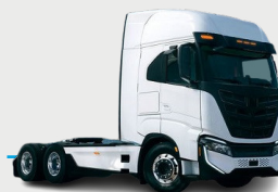
TRACTEUR PILE À COMBUSTIBLE IVECO