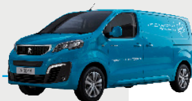
PEUGEOT EXPERT Autonomie : 400 km