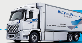
HYUNDAI XCIENT FUEL CELL