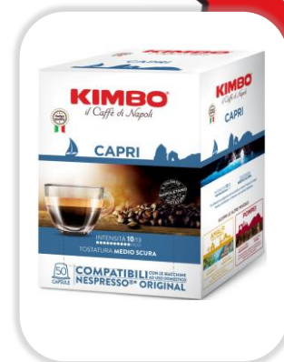
KIMBO ESPRESSO CAPRI caps NC Pack x50 caps