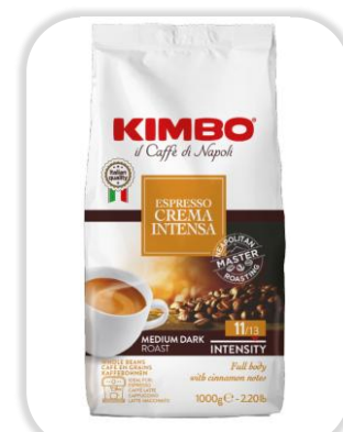
KIMBO CREMA INTENSA 1KG Grains

ESPRESSO BARISTA 100% ARABICA: Un café 100% Arabica d'Amérique centrale & Sud, au caractère affirmé, mêlant arômes floraux et notes toastées