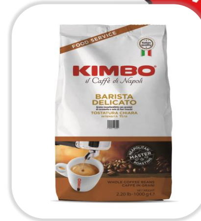
KIMBO BARISTA DELICATO 1Kg Grains