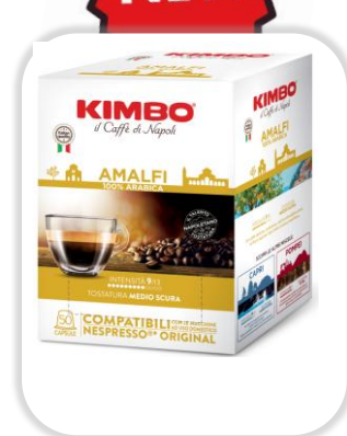
KIMBO ESPRESSO AMALFI caps NC Pack x50 caps