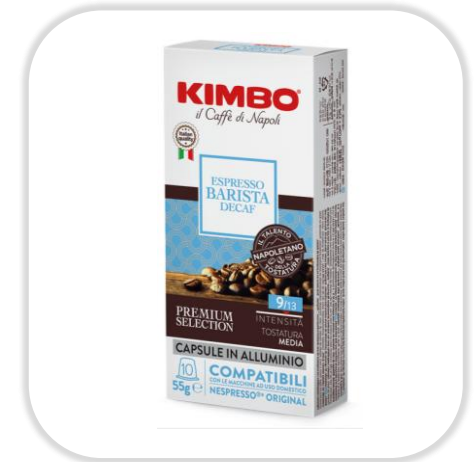
KIMBO ESPRESSO BARISTA DECAFEINE caps NC Pack x10 caps

Café Arabica et Robusta, torréfié foncé, avec des arômes puissants de chocolat noir, idéal pour un espresso ou ristretto intense.