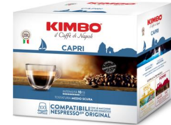
KIMBO ESPRESSO CAPRI caps NC Pack x100 caps