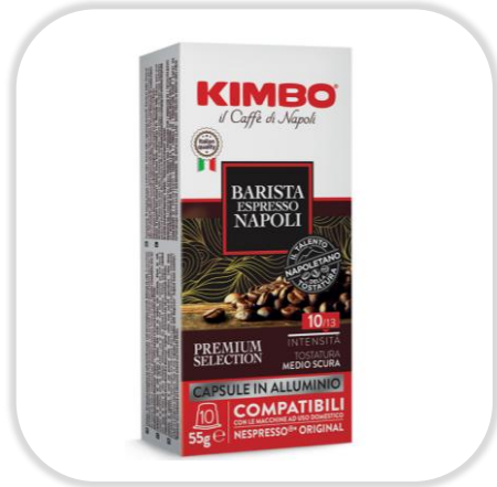
KIMBO ESPRESSO BARISTA NAPOLI caps NC Pack x10 caps