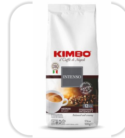
KIMBO INTENSO 500 G Grains

Un café intense, torréfié à la napolitaine, mêlant arômes toastés et épicés, avec une finale corsée.