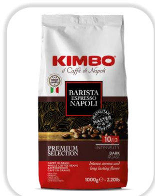
KIMBO ESPRESSO NAPOLI 1KG Grains

AROMA GOLD 100% ARABICA: Un café 100% arabica, équilibré entre douceur et acidité, au goût raffiné.