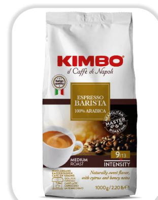
KIMBO BARISTA 100% ARABICA 1KG Grains

INTENSO: Un café issu d'une sélection rigoureuse, intense et épicé, avec une onctuosité persistante et un corps plein.