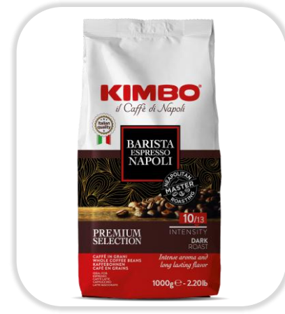
KIMBO ESPRESSO NAPOLI 500 G Grains

Un café 100% Arabica d'Amérique centrale et du Sud, au caractère affirmé, mêlant arômes floraux et notes toastées.