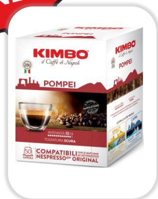
KIMBO ESPRESSO POMPEI caps NC Pack x50 caps