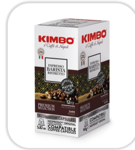
KIMBO ESPRESSO BARISTA RISTRETTO caps NC Pack x30 caps

Café 100% Arabica, torréfié moyen-foncé, arôme de pain grillé et notes florales, pour un espresso doux, élégant et raffiné.