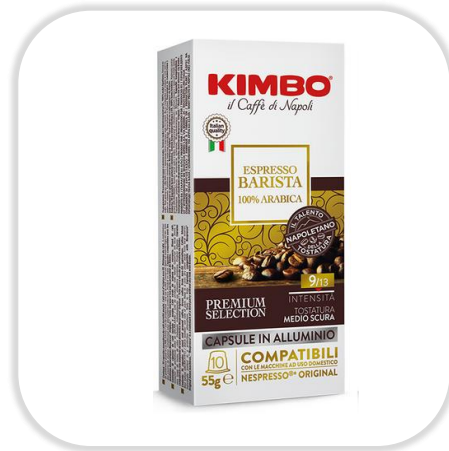
KIMBO ESPRESSO BARISTA 100% Arabica caps NC Pack x10 caps

Composé d'Arabica et de Robusta, ce café torréfié moyennement foncé offre des arômes de biscuit, une intensité prononcée et un espresso riche.