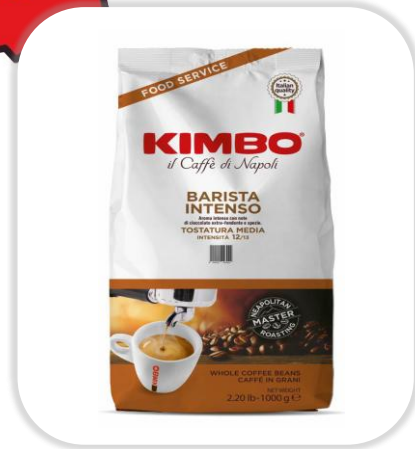
KIMBO BARISTA INTENSO 1 Kg Grains