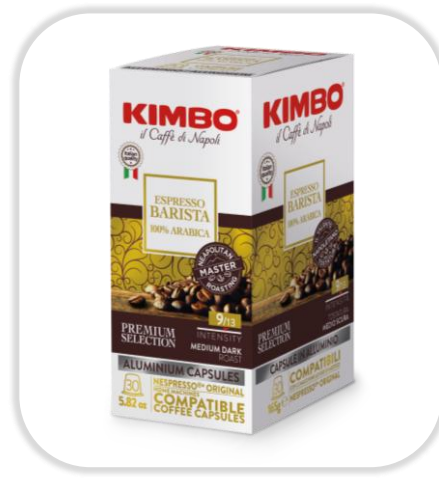
KIMBO ESPRESSO BARISTA 100% Arabica caps NC Pack x30 caps

Composé d'Arabica et de Robusta, ce café torréfié moyennement foncé offre des arômes de biscuit, une intensité prononcée et un espresso riche.