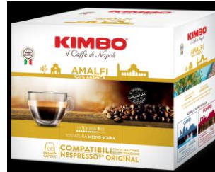
KIMBO ESPRESSO Amalfi 100% Arabica caps NC Pack x100 caps