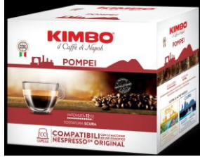
KIMBO ESPRESSO POMPEI caps NC Pack x100 caps