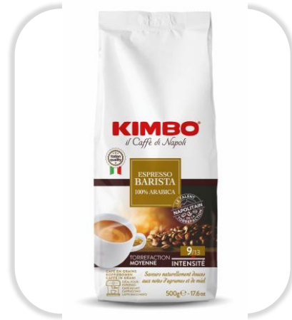
KIMBO AROMA GOLD 100% ARABICA 500 G Grains