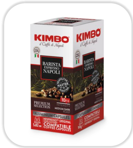
KIMBO ESPRESSO BARISTA NAPOLI caps NC Pack x30 caps