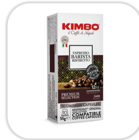
KIMBO ESPRESSO BARISTA RISTRETTO caps NC Pack x10 caps

Café 100% Arabica, torréfié moyen-foncé, arôme de pain grillé et notes florales, pour un espresso doux, élégant et raffiné.