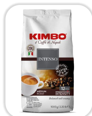
KIMBO INTENSO 1KG Grains

ESPRESSO NAPOLI: Un café intense, torréfié à la napolitaine, mêlant arômes toastés et épicés, avec une finale corsée.