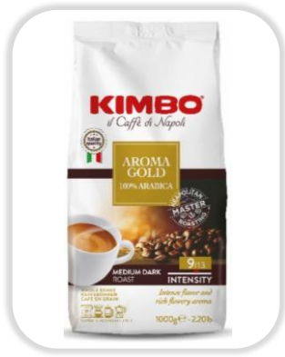
KIMBO AROMA GOLD 100% ARABICA 1KG Grains