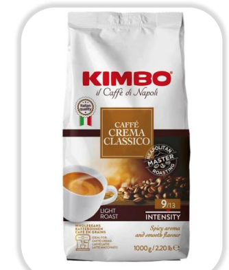
KIMBO CREMA CLASSICO 1KG Grains

ESPRESSO CREMA INTENSA: Un mélange équilibré d'Arabica et de Robusta, crémeux et dense, aux arômes intenses de réglisse, poivre et cannelle.