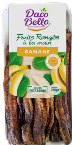
Bananes séchées 250g x 24 UVC