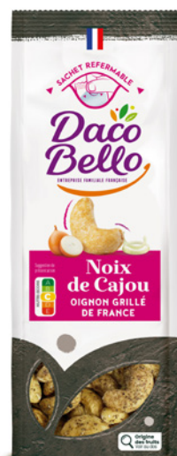
Noix de Cajou Oignon grillé