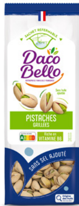
Pistaches grillées non salées Origine USA 250g x 12 UVC