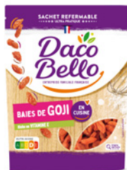
Baies de goji 125g x 12 UVC