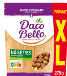
Noisettes décortiquées Format Familial 275g x 12 UVC