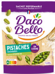
Pistaches crues émondées 100g x 12 UVC