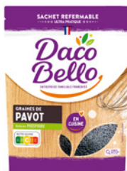
Graines de pavot 125g x 12 UVC