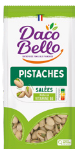
Pistaches grillées salées Origine Orient 200g x 12 UVC