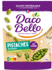
Pistaches crues émondées 125g x 12 UVC