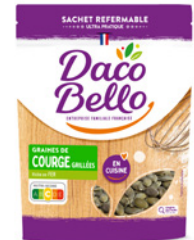
Graines de courge décortiquées grillées 125g x 12 UVC