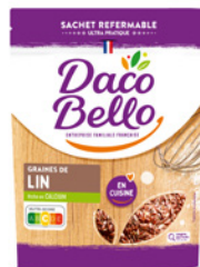
Graines de lin 125g x 12 UVC