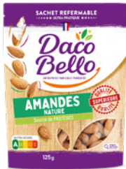
Amandes décortiquées 125g x 12 UVC

C'est une sélection de fruits secs et de graines de qualité, idéalement conservés grâce à leur sachet refermable ultra pratique.