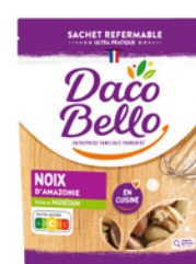
Noix d'Amazonie 125g x 12 UVC