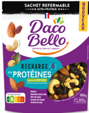
Recharge Protéines 150g x 12 UVC

Avec nos nouveaux mélanges délicieusement originaux Recharge Protéines et Recharge Énergie : que ce soit pour bien commencer la journée, pour booster vos performances ou encore dans le cadre d'un régime alimentaire particulier, nos mélanges sont adaptés à vos besoins.