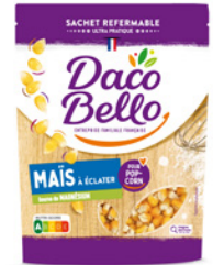
Maïs à éclater 250g x 12 UVC