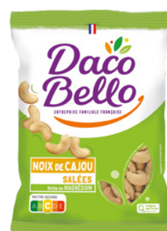
Noix de cajou grillées salées 400g x 20 UVC