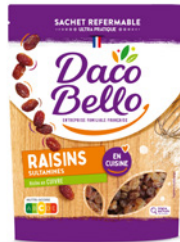
Raisins sultanes 250g x 12 UVC