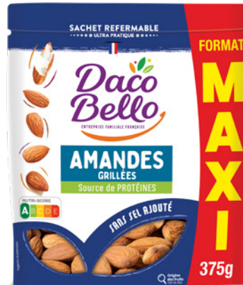
Amandes grillées MAXI