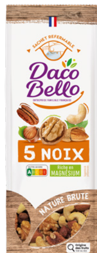
5 Noix 150g x 12 UVC