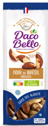
Noix du Brésil grillées non salées 175g x 12 UVC