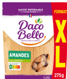
Amandes décortiquées Format Familial 275g x 12 UVC