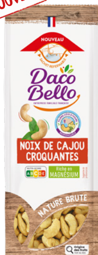
Noix de cajou croquantes 150g x 12 UVC