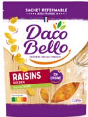
Raisins golden 250g x 12 UVC