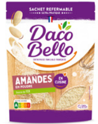
Amandes en poudre 125g x 12 UVC