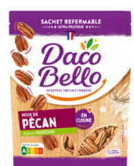
Noix de pécan 125g x 12 UVC