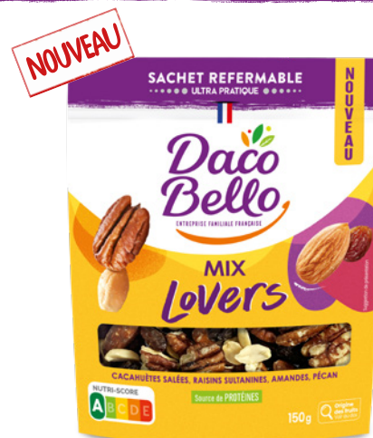
Mix Lovers 150g x 12 UVC