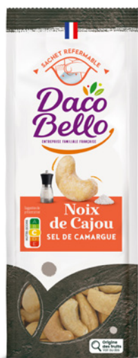
Noix de Cajou Sel de Camargue