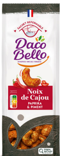
Noix de Cajou Paprika Piment