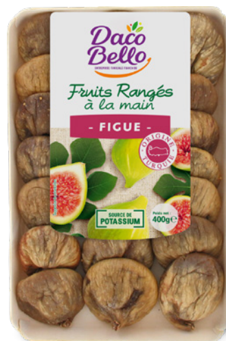
Figues séchées 400g x 24 UVC