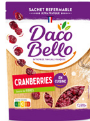
Cranberries 200g x 12 UVC