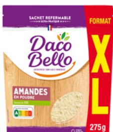
Amandes en poudre Format Familial 275g x 12 UVC