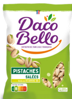
Pistaches grillées salées Origine Orient 400g x 20 UVC