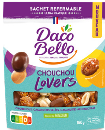
Chouchou Lovers 150g x 12 UVC