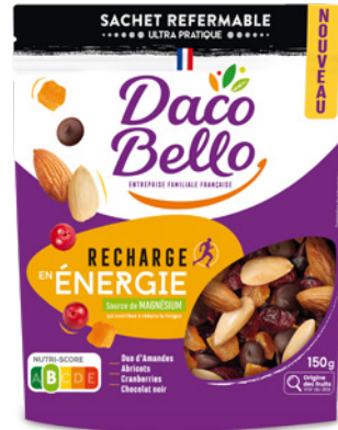
Recharge Énergie 150g x 12 UVC