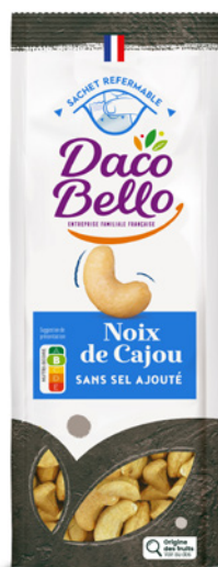
Noix de Cajou Sans Sel

Nous avons créé nos propres recettes, imaginant des alliances originales à base d'épices et d'herbes, pour réinventer l'apéritif.