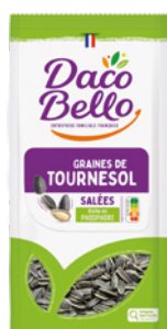
Graines de tournesol grillées salées 150g x 12 UVC