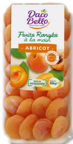
Abricots secs 300g x 24 UVC

C'est une sélection de fruits séchés entiers à gros calibre soigneusement triés, lavés et rangés à la main dans une barquette en bois de peuplier naturel.