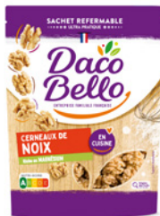
Cerneaux de noix 125g x 12 UVC