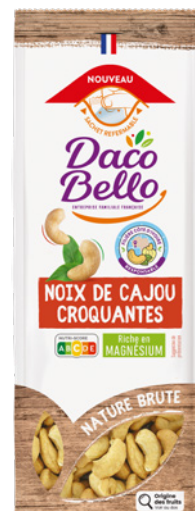
Noix de cajou croquantes 150g x 12 UVC