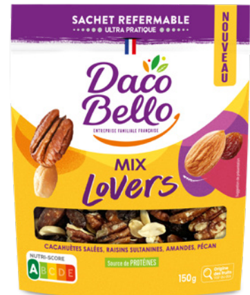
Mix Lovers 150g x 12 UVC