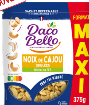
Cajou grillées MAXI 375g x 12 UVC