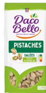
Pistaches grillées salées Origine USA 250g x 12 UVC