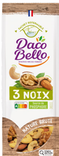
3 Noix 150g x 12 UVC