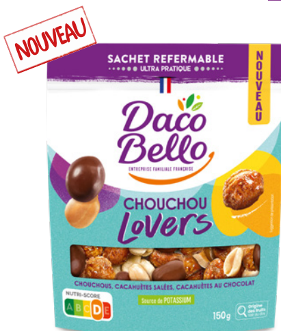
Chouchou Lovers 150g x 12 UVC

Vous aimez craquer quand c'est gourmand ? Notre gamme Lovers vous fera fondre de plaisir. Des mélanges innovants, gourmands pour un voyage sucré-salé. Découvrez sans plus tarder notre Chouchou Lovers ainsi que notre Mix Lovers !