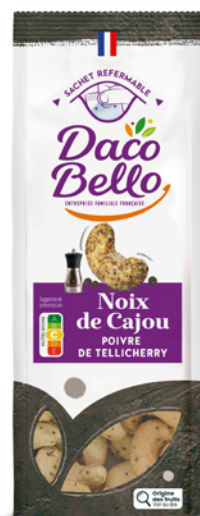
Noix de Cajou Poivre de Tellicherry