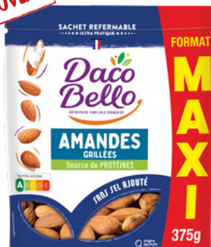
Amandes grillées MAXI 375g x 12 UVC