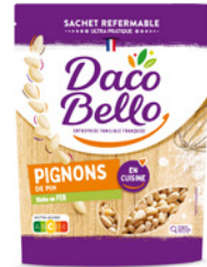
Pignons de pin 100g x 12 UVC