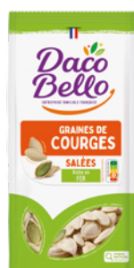
Graines de courge grillées salées 200g x 12 UVC