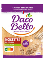
Noisettes en poudre 100g x 12 UVC