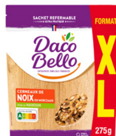
Cerneaux de Noix Format Familial 275g x 12 UVC