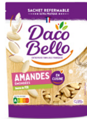
Amandes émondées 125g x 12 UVC