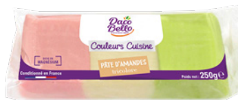
Pâte d'amandes tricolore 26% 250g x 24 UVC