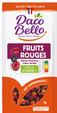
Mélange Fruits Rouges Cranberries, cerises, myrtilles 125g x 12 UVC