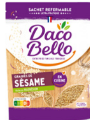
Graines de sésame 125g x 12 UVC