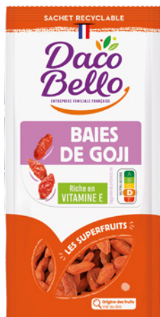
Baies de goji 125g x 6 UVC ou x 12 UVC

Nos petits fruits subliment toutes vos envies gourmandes d'une touche colorée, acidulée et sucrée ! Intégrés dans vos recettes préférées, ces petits bien faits sont de précieux alliés grâce à leur richesse nutritionnelle.