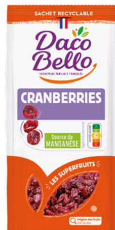
Cranberries 125g x 12 UVC