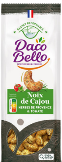
Noix de Cajou Herbes de Provence