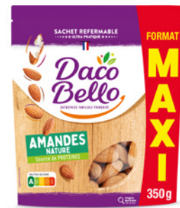
Amandes Nature Format MAXI 350g x 12 UVC