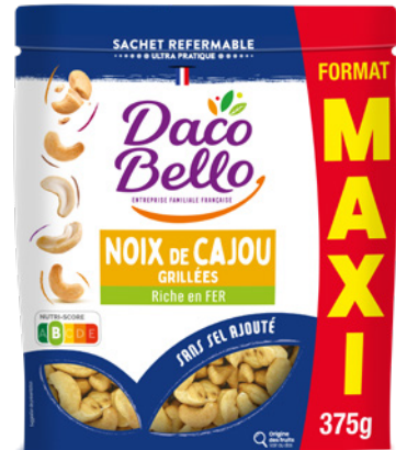
Noix de cajou grillées MAXI