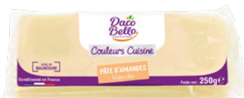
Pâte d'amandes blanche 26% 250g x 24 UVC