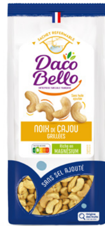
Noix de cajou grillées non salées 225g x 12 UVC