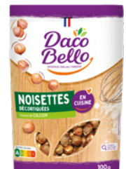
Noisettes décortiquées 100g x 12 UVC