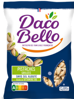
Pistaches grillées non salées Origine Orient 400g x 20 UVC