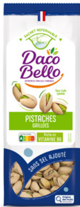
Pistaches grillées non salées Origine Orient 200g x 12 UVC