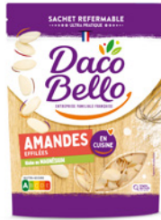
Amandes effilées 125g x 12 UVC