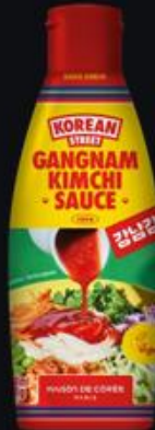
Sauce kimchi 260g Shelf life : 18 months