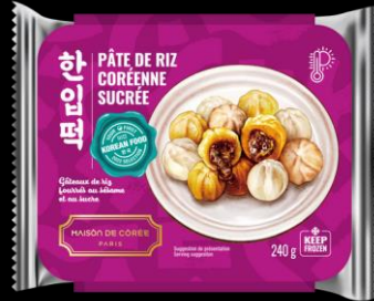
Pâte de riz coréenne sucrée 240g Shelf life : 24 months