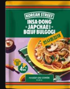
Insadong Japchae 103g Shelf life : 18 months