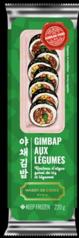
Gimnap Légumes 220g Shelf life : 18 months