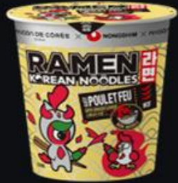
Ramen Poulet Feu 75g Shelf life : 12 months