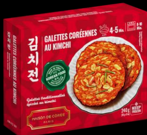
Galettes Coréennes Kimchi 240g Shelf life : 24 months