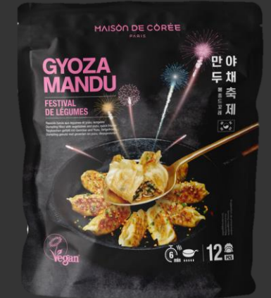
Gyoza Mandu Légumes 270g Shelf life : 24mois