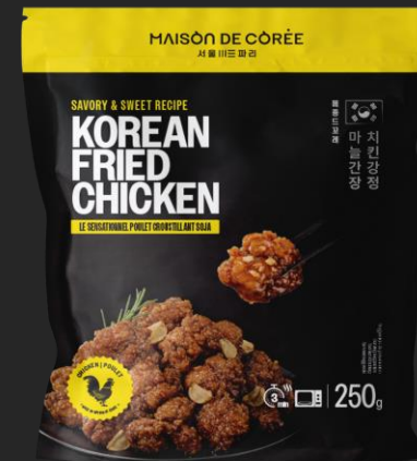
KOREAN FRIED CHICKEN SOJA 250g Shelf life : 24 months