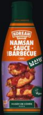
Sauce BBQ 260g Shelf life : 18 months