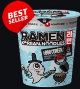
Ramen BBQ 75g Shelf life : 12 months