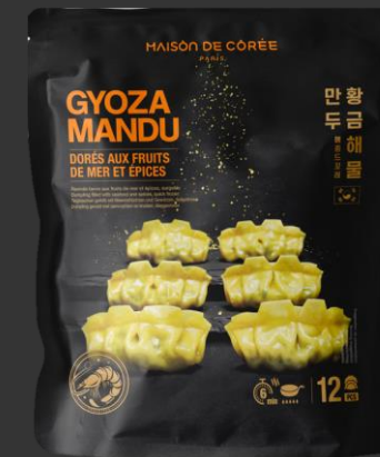
Gyoza Mandu Fruits de mer 270g Shelf life : 24mois