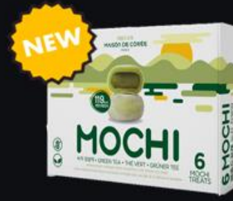
Disponibilité Novembre 2024 Mochi Matcha 210g Shelf life : 12 months