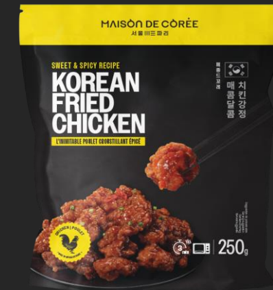
KOREAN FRIED CHICKEN EPICE 250g Shelf life : 24 months