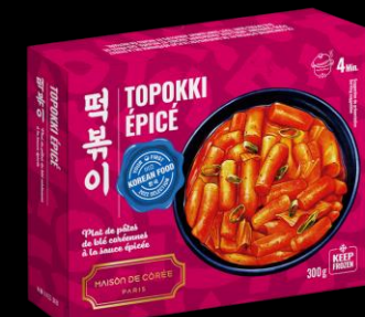
Topokki Epicé 300g Shelf life : 24 months