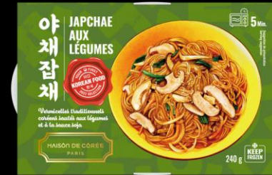
Japchae Légumes 240g Shelf life : 24 months