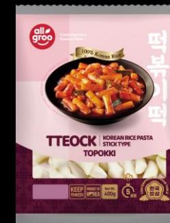
Pâte de riz Coréenne 400g Shelf life : 24 months