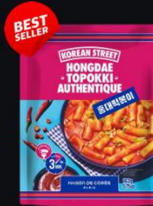
Hongdae Topokki 163g Shelf life : 18 months