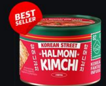
Kimchi Conserve 160g Shelf life : 24 months