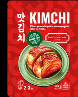
Kimchi 240g Shelf life : 24 months