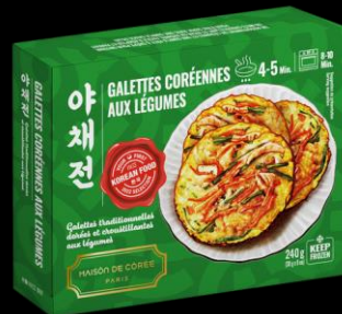
Galette Coréennes Légumes 240g Shelf life : 24 months