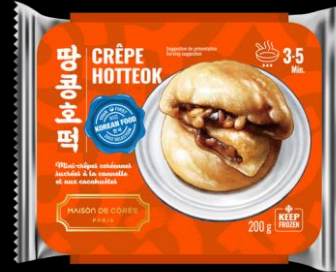
Crêpes Hotteok 200g Shelf life : 24 months