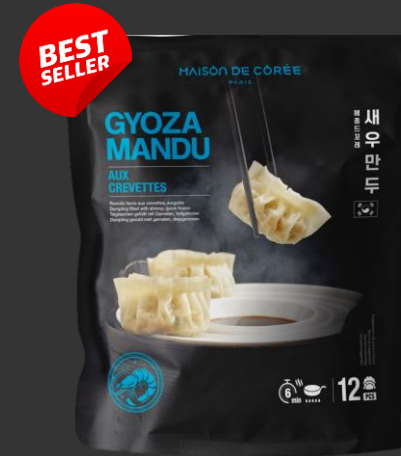
Gyoza Mandu Crevettes 270g Shelf life : 24mois