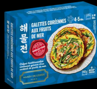
Galette Coréennes Fruits de mer 240g Shelf life : 24 months