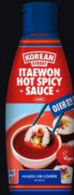
Sauce piment 260g Shelf life : 18 months