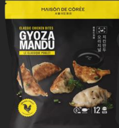
GYOZA MANDU POULET SOJA 240g Shelf life : 24 months