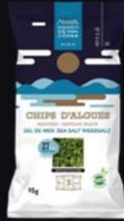
Chips d'algues Sel Mer 15g Shelf life : 24 months