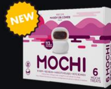
Disponibilité Novembre 2024 Mochi Haricots Rouges 210g Shelf life : 12 months