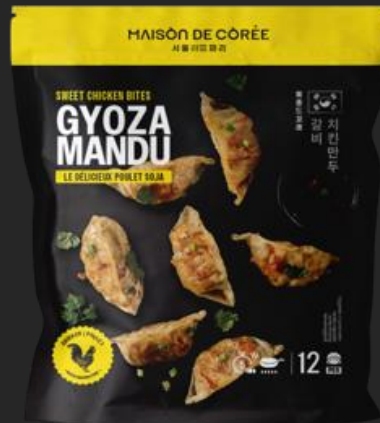
GYOZA MANDU POULET CLASSIQUE 240g Shelf life : 24 months