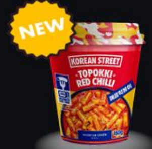
Disponibilité Novembre 2024 Topokki Epicé 160g Shelf life : 18 months