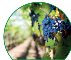
arboriculture / viticulture