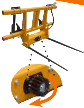
Tablier Pick & Go 1

EMILY - ZA Les Landes - 29800 Tréflévénéz - France T. +33 (0)2 98 21 72 72 / F. +33 (0)2 98 21 86 14 emily@emily.fr