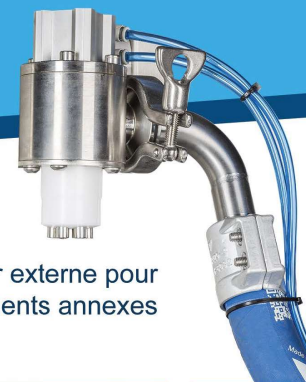
Doseur externe pour conditionnements annexes