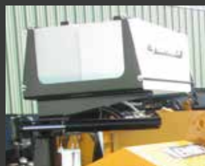
Arrosage (en option)