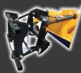
Tablier flottant adaptable sur 3 pts d'origine