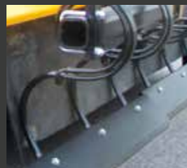
Lame de raclage : 3 sections sur la 2,50 m 2 sections sur la 2,20m