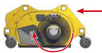
Schéma de coupe de la balayeuse ramasseuse.