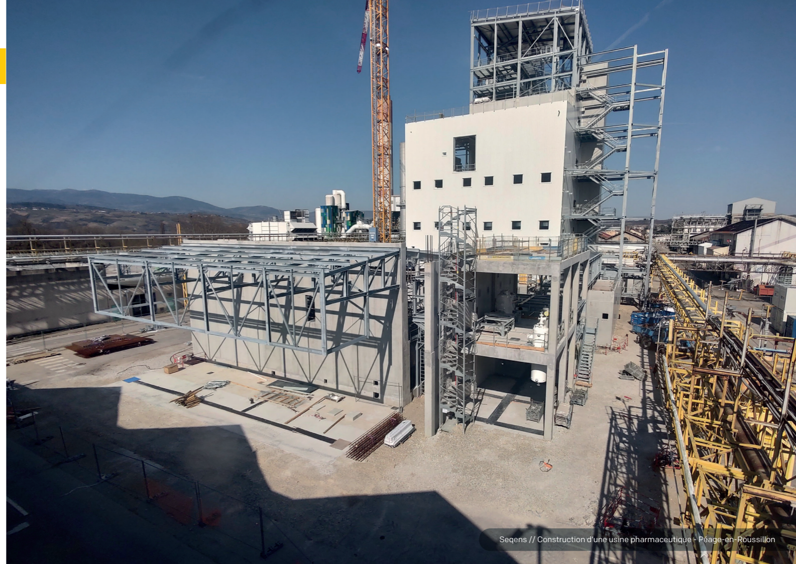
Seqens // Construction d'une usine pharmaceutique - Péage-en-Roussillon