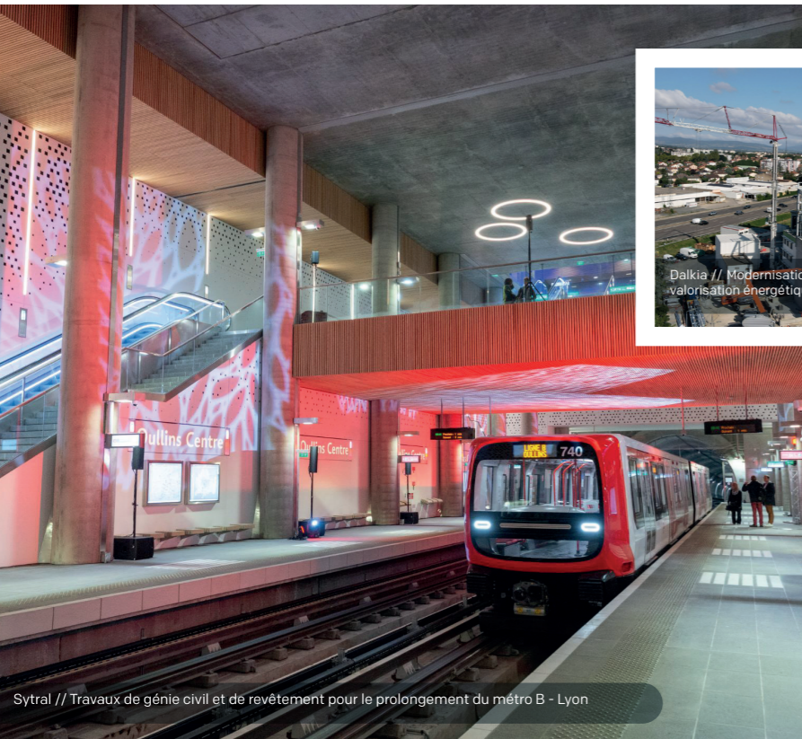
Sytral // Travaux de génie civil et de revêtement pour le prolongement du métro B - Lyon