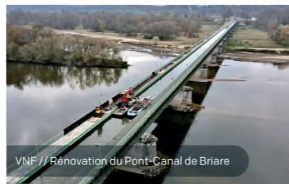
VNF // Rénovation du Pont-Canal de Briare