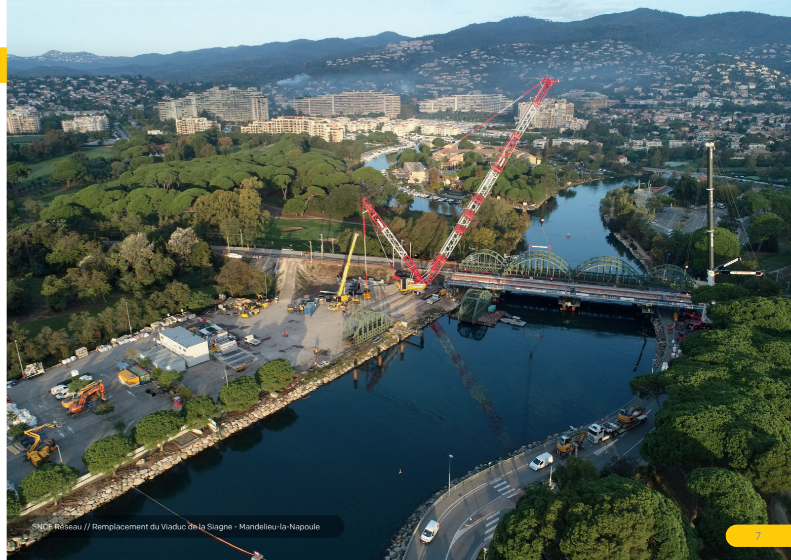
SNCF Réseau // Remplacement du Viaduc de la Siagne - Mandelieu-la-Napoule

Qualifications FNTF Ouvrages d'art hautes technicités, Plus de 20 qualifications techniques SNCF, Personnel qualifié Sécufer, Adhérent de l'AFGC.