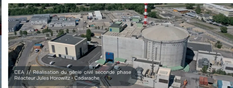
CEA // Réalisation du génie civil seconde phase Réacteur Jules Horowitz - Cadarache