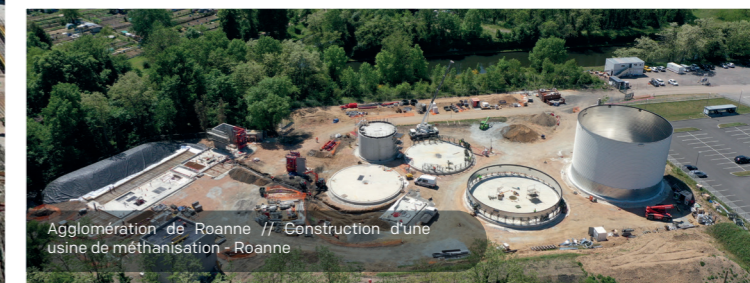
Agglomération de Roanne // Construction d'une usine de méthanisation - Roanne