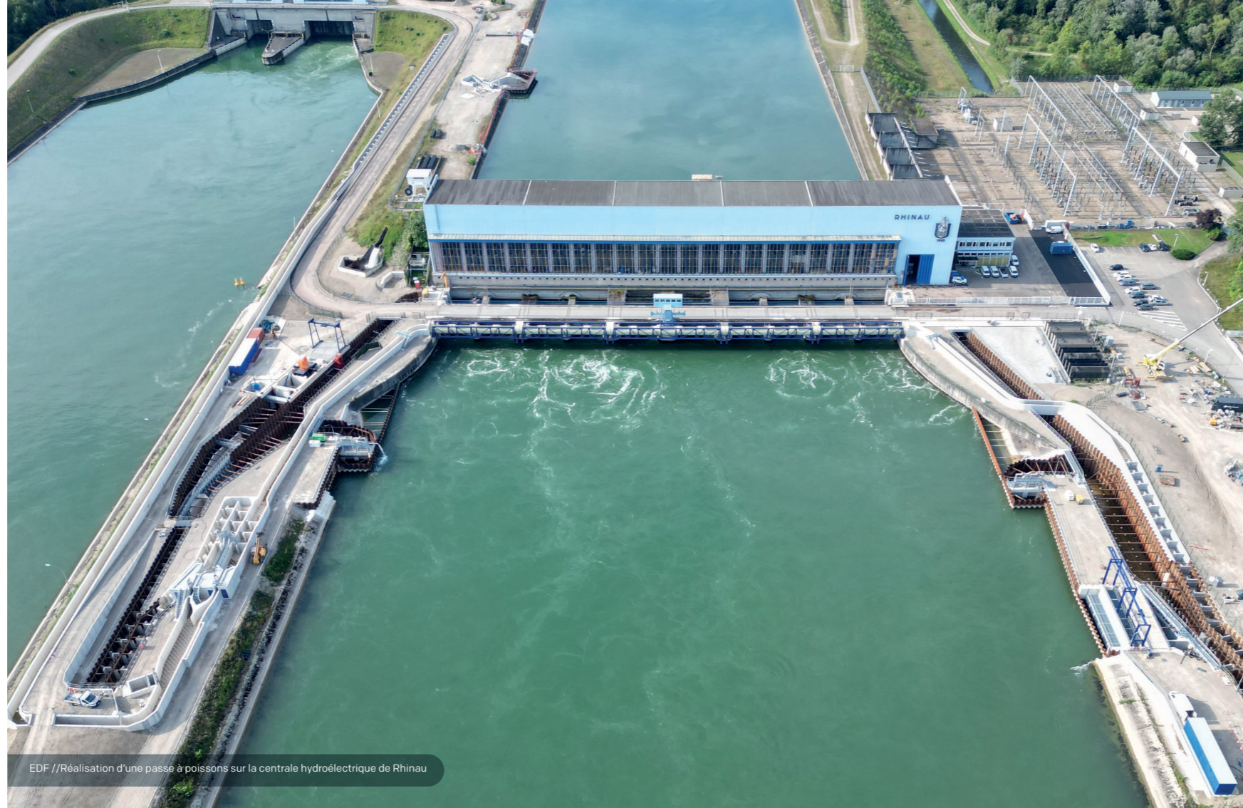
EDF // Réalisation d'une passe à poissons sur la centrale hydroélectrique de Rhinau