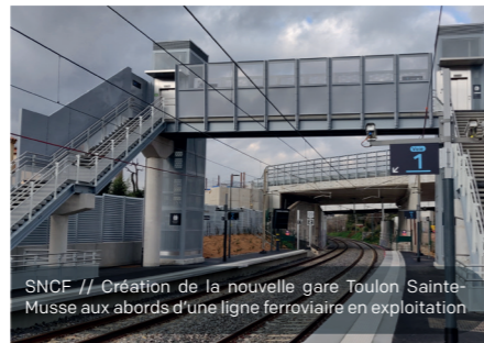
SNCF // Création de la nouvelle gare Toulon Sainte-Musse aux abords d'une ligne ferroviaire en exploitation