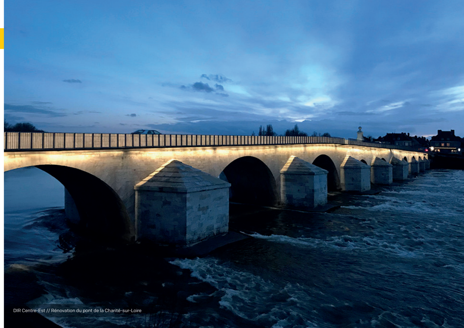
DIR Centre-Est // Rénovation du pont de la Charité-sur-Loire