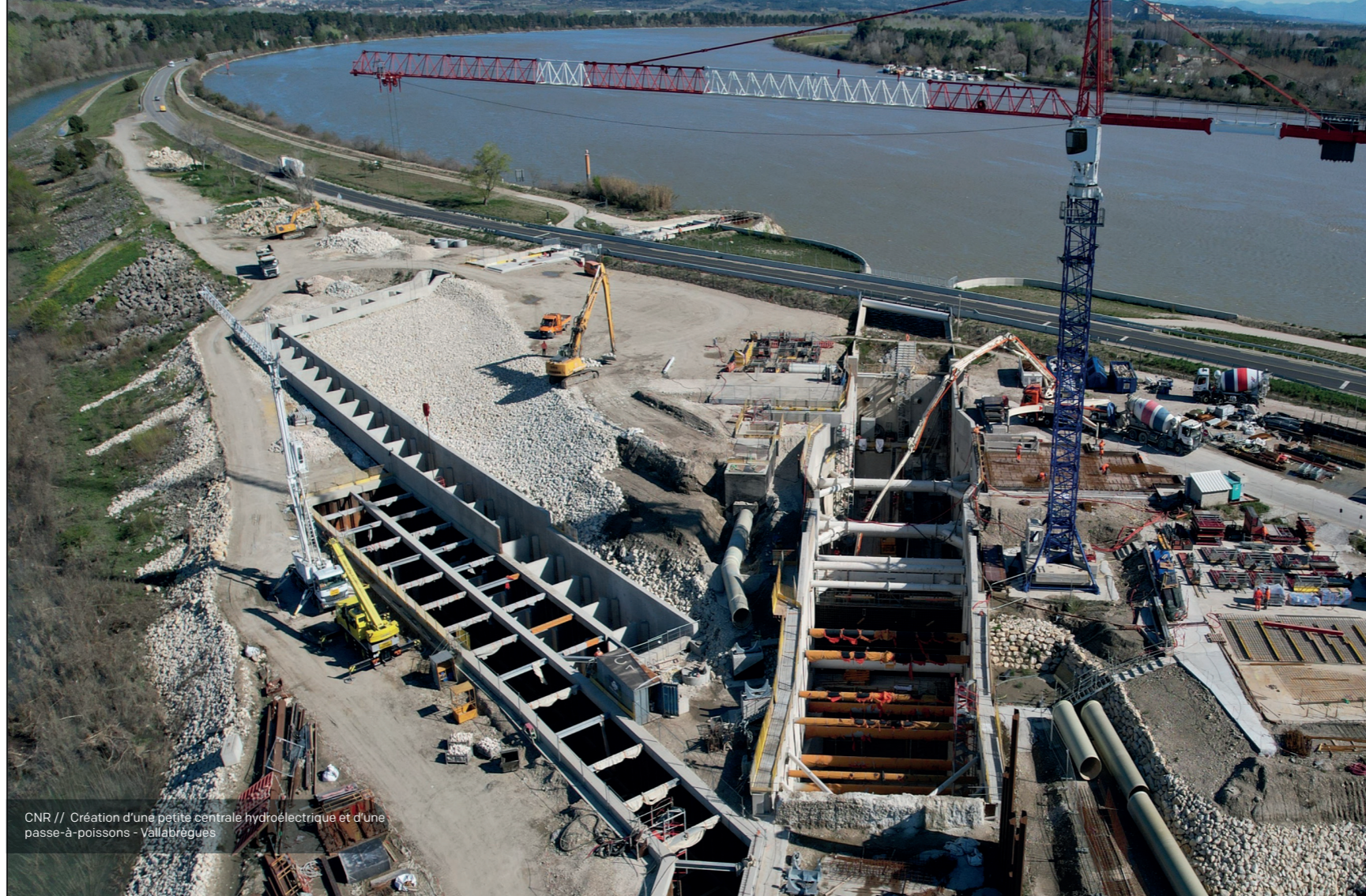
CNR // Création d'une petite centrale hydroélectrique et d'une passe-à-poissons - Vallabrigues

UTO génie civil, CEFRI Travaux de maintenance ou d'intervention en zones, FNTP Ouvrages de hautes technicités fluviales & maritimes.