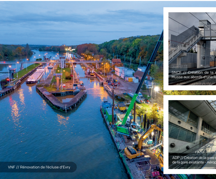
VNF // Rénovation de l'écluse d'Evry