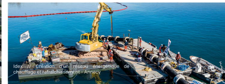
IDEX // Création d'un réseau énergétique de chauffage et rafraîchissement - Annecy