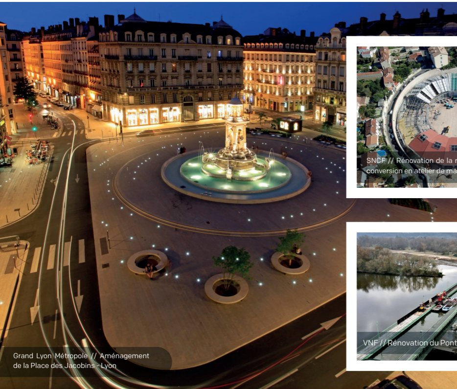
Grand Lyon Métropole // Aménagement de la Place des Jacobins - Lyon