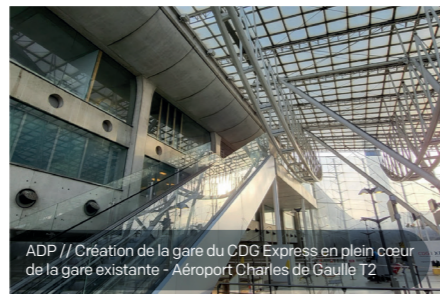
ADP // Création de la gare du CDG Express en plein cœur de la gare existante - Aéroport Charles de Gaulle T2