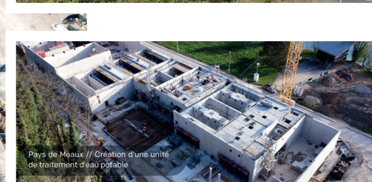
Pays de Meaux // Création d'une unité de traitement d'eau potable