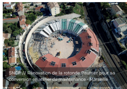
SNCF // Rénovation de la rotonde Pautrier pour sa conversion en atelier de maintenance - Marseille