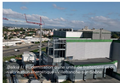
Dalkia // Modernisation d'une unité de traitement et de valorisation énergétique - Villefranche-sur-Saône