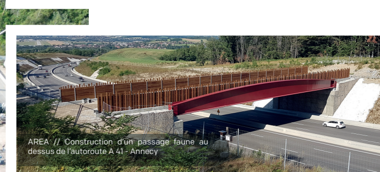
AREA // Construction d'un passage faune au dessus de l'autoroute A 41 - Annecy