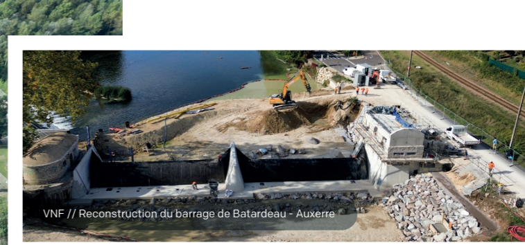
VNF // Reconstruction du barrage de Batardeau - Auxerre