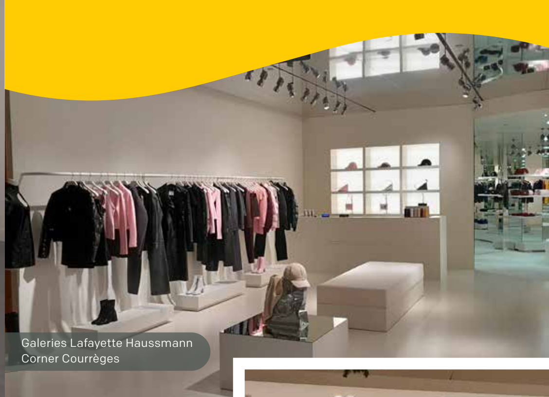
Galeries Lafayette Haussmann Corner Courrèges