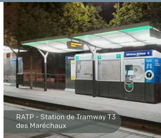
RATP - Station de Tramway T3 des Maréchaux