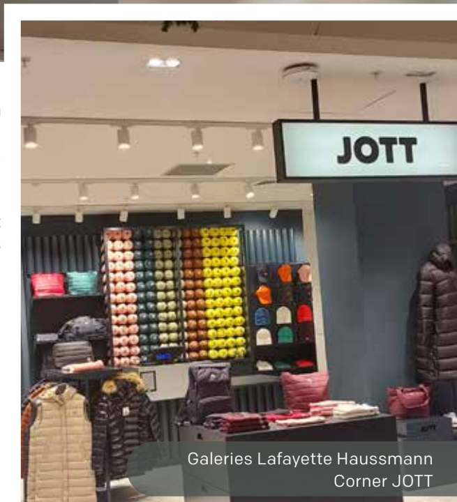
Galeries Lafayette Haussmann Corner JOTT