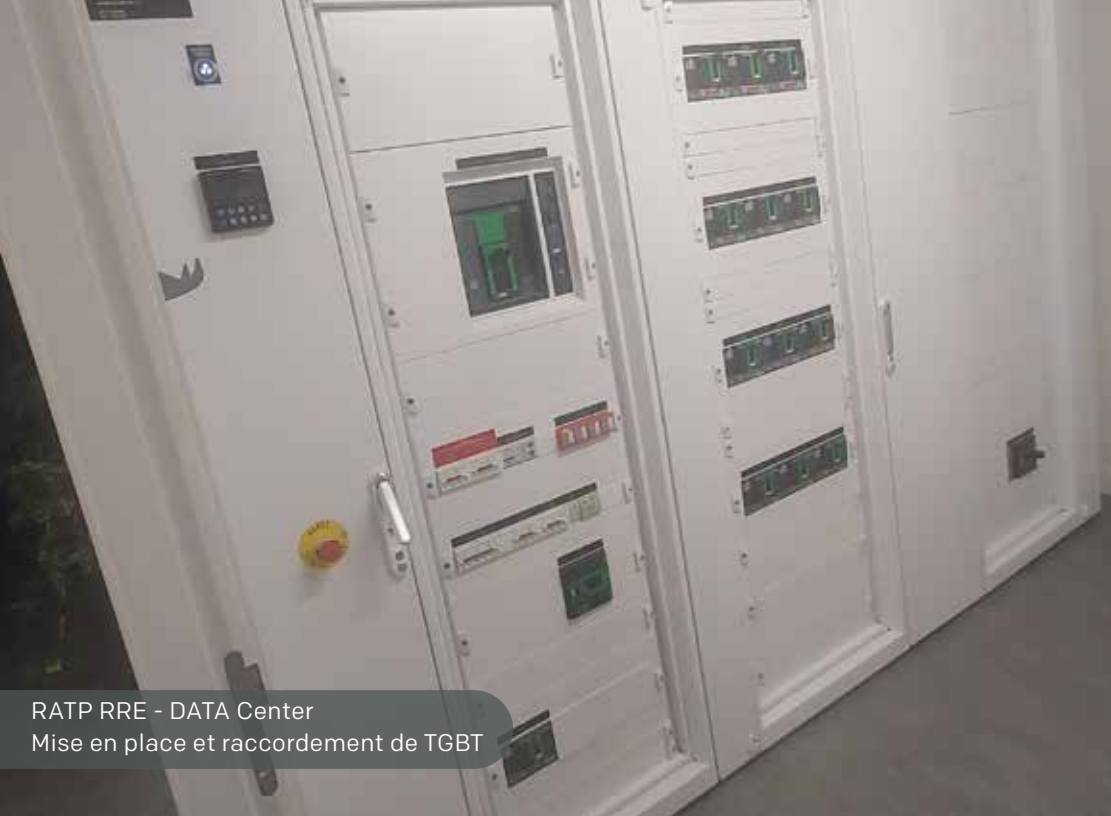
RATP RRE - DATA Center Mise en place et raccordement de TGBT