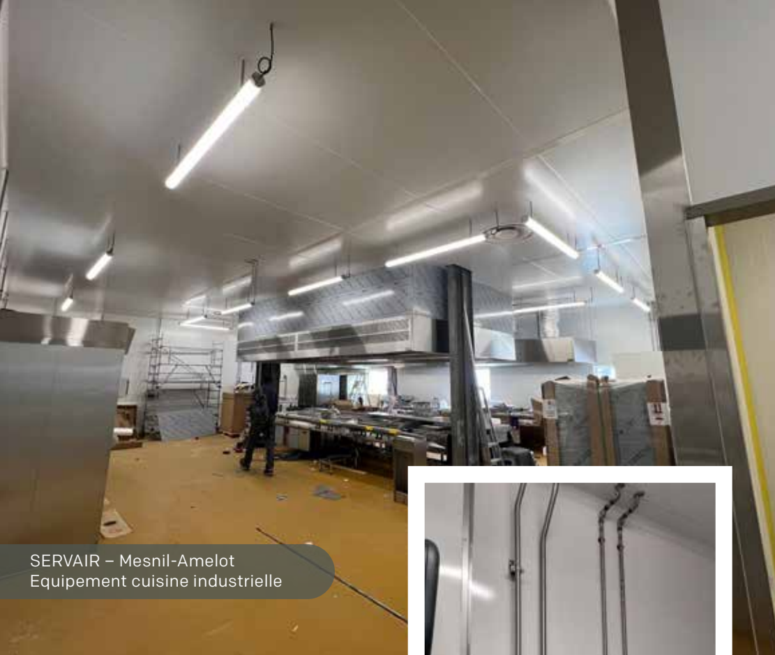
SERVAIR – Mesnil-Amelot Équipement cuisine industrielle