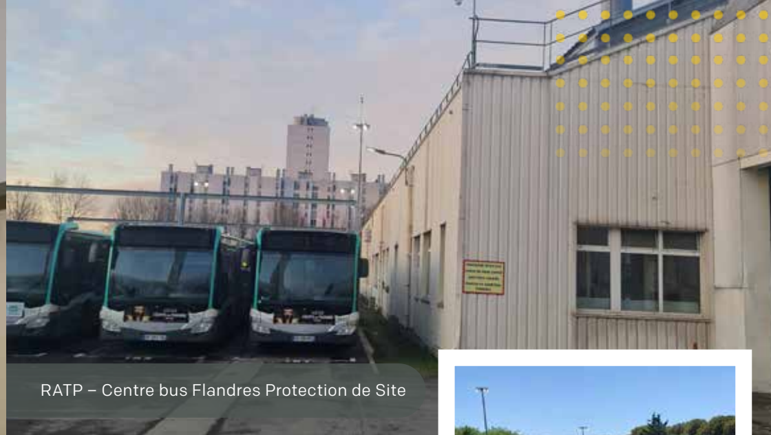
RATP – Centre bus Flandres Protection de Site