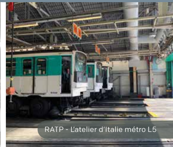
RATP - L'atelier d'Italie métro L5