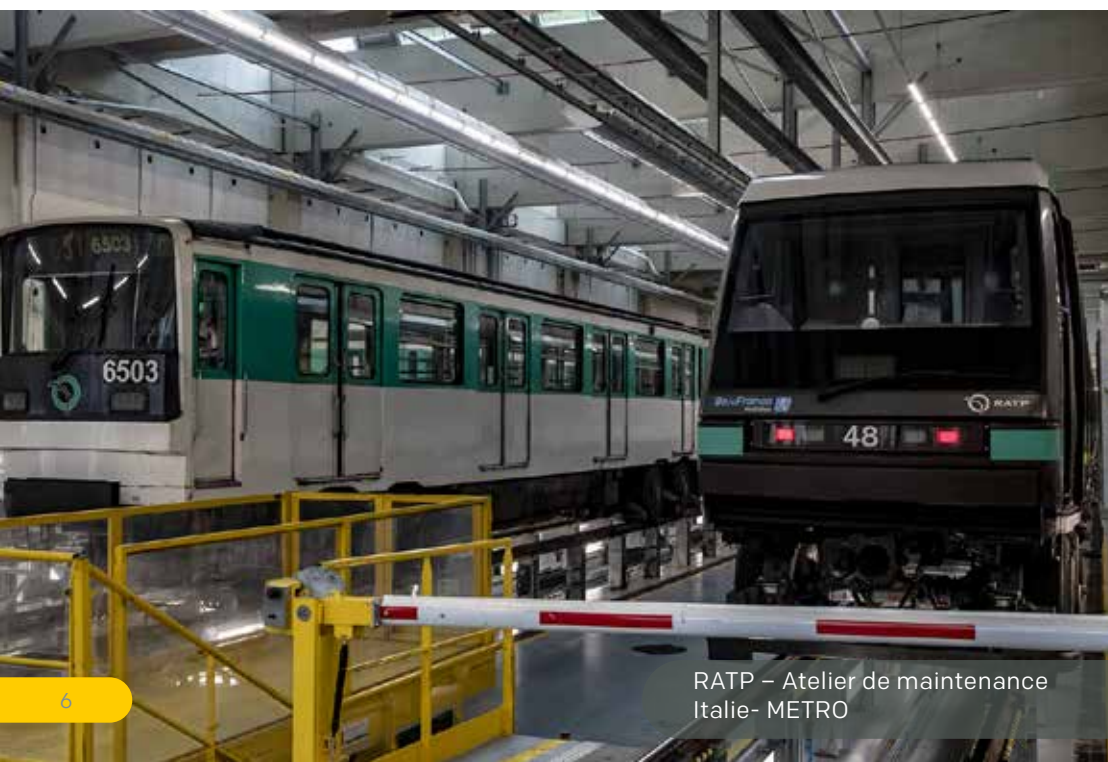
RATP - Atelier de maintenance Italie- METRO