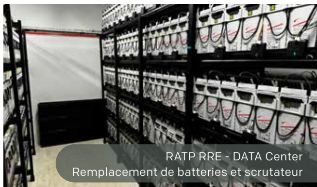
RATP RRE - DATA Center Remplacement de batteries et scrutateur