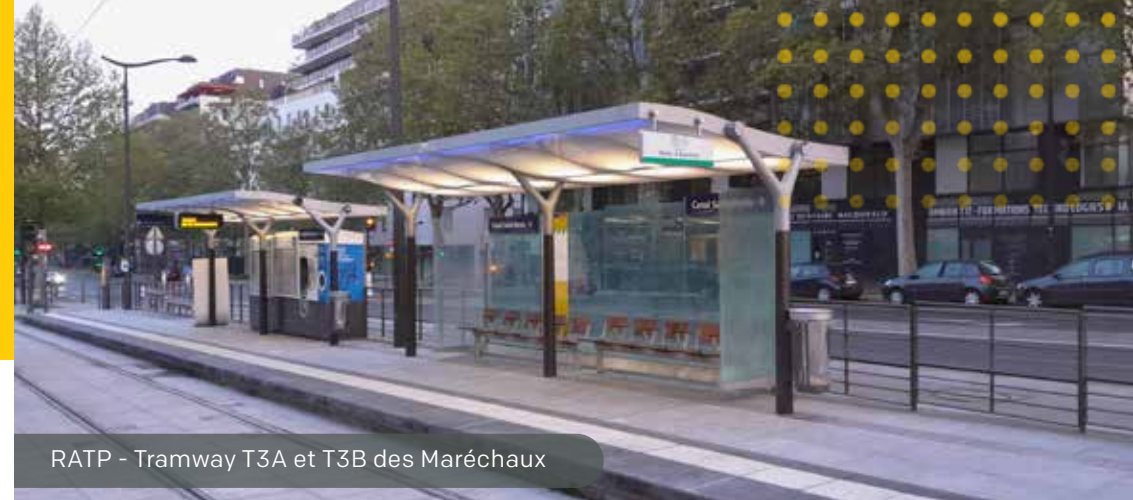
RATP - Tramway T3A et T3B des Maréchaux