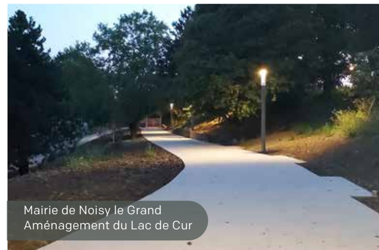
Mairie de Noisy le Grand Aménagement du Lac de Cur