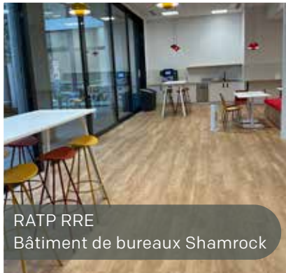
RATP RRE Bâtiment de bureaux Shamrock