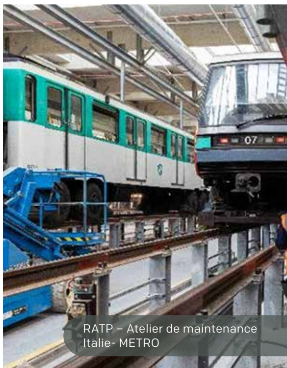
RATP – Atelier de maintenance Italie- METRO