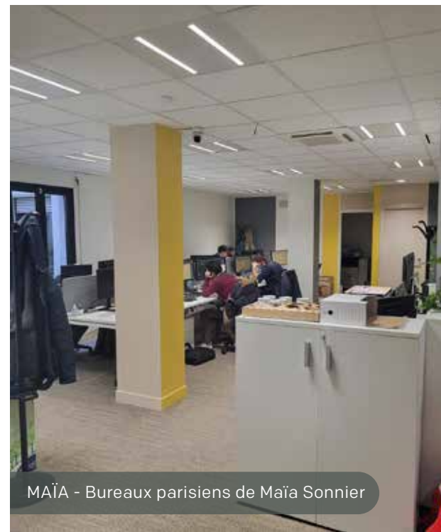
MAÏA - Bureaux parisiens de Maïa Sonnier