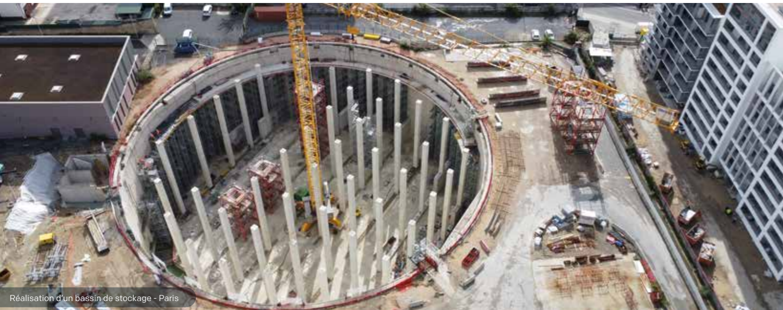
Réalisation d'un bassin de stockage - Paris