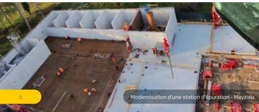
Modernisation d'une station d'épuration - Meyzieu