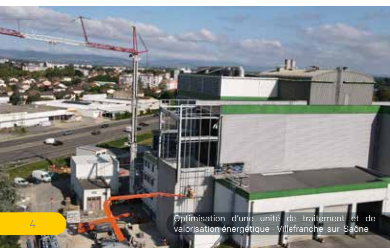
Optimisation d'une unité de traitement et de valorisation énergétique - Villefranche-sur-Saône

Coordination multi-métiers, maintenance des ouvrages et accompagnement à la décarbonation.