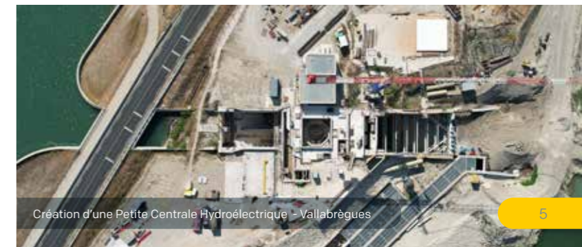
Création d'une Petite Centrale Hydroélectrique - Vallabregues