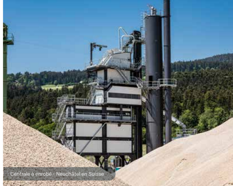
Centrale à enrobé - Neuchâtel en Suisse

Assurer le maintien des activités pendant toute la durée du chantier.