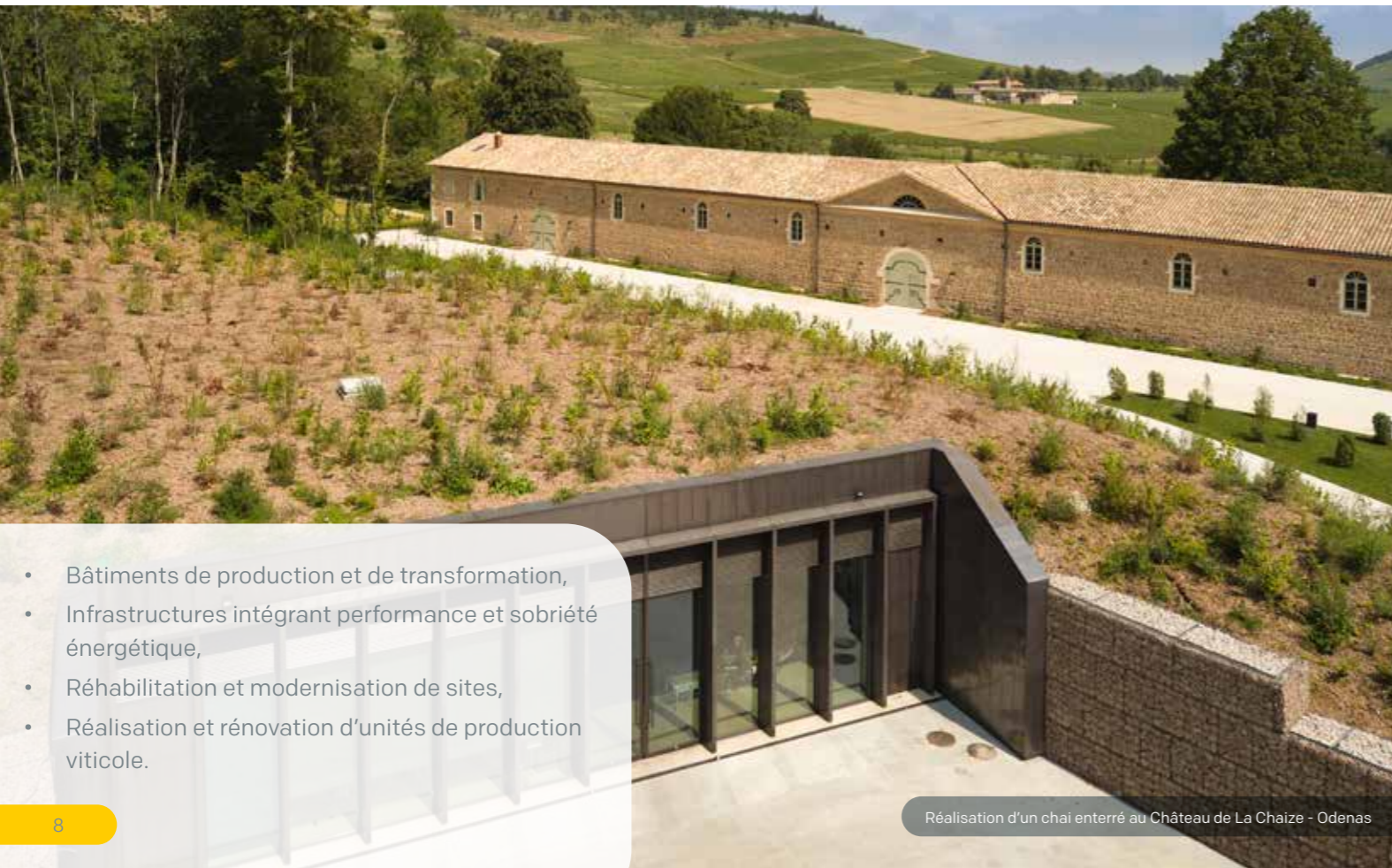
Réalisation d'un chai enterré au Château de La Chaize - Odenas