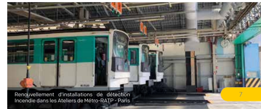
Renouvellement d'installations de détection Incendie dans les Ateliers de Métro-RATP - Paris