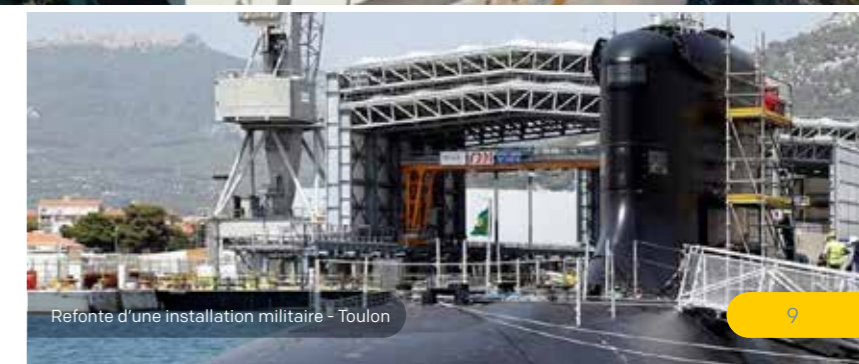
Refonte d'une installation militaire - Toulon