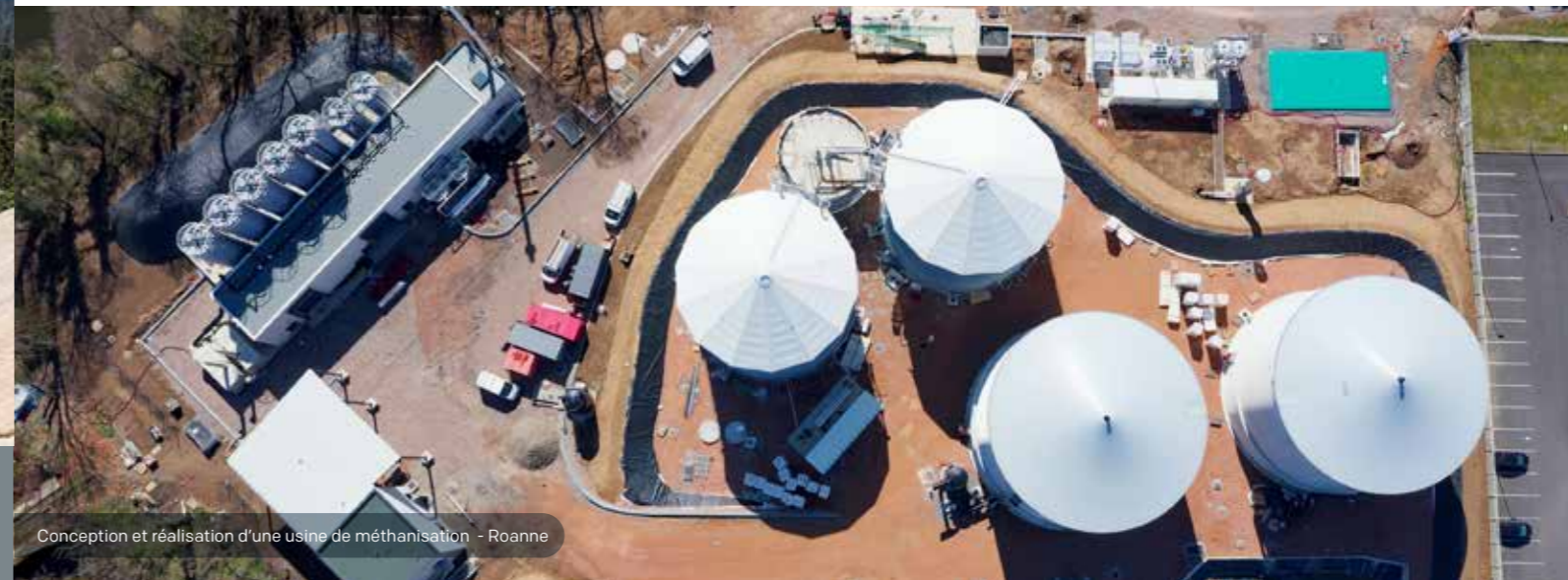
Conception et réalisation d'une usine de méthanisation - Roanne