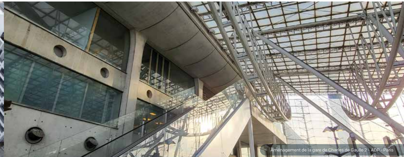
Aménagement de la gare de Charles de Gaulle 2 - ADP - Paris