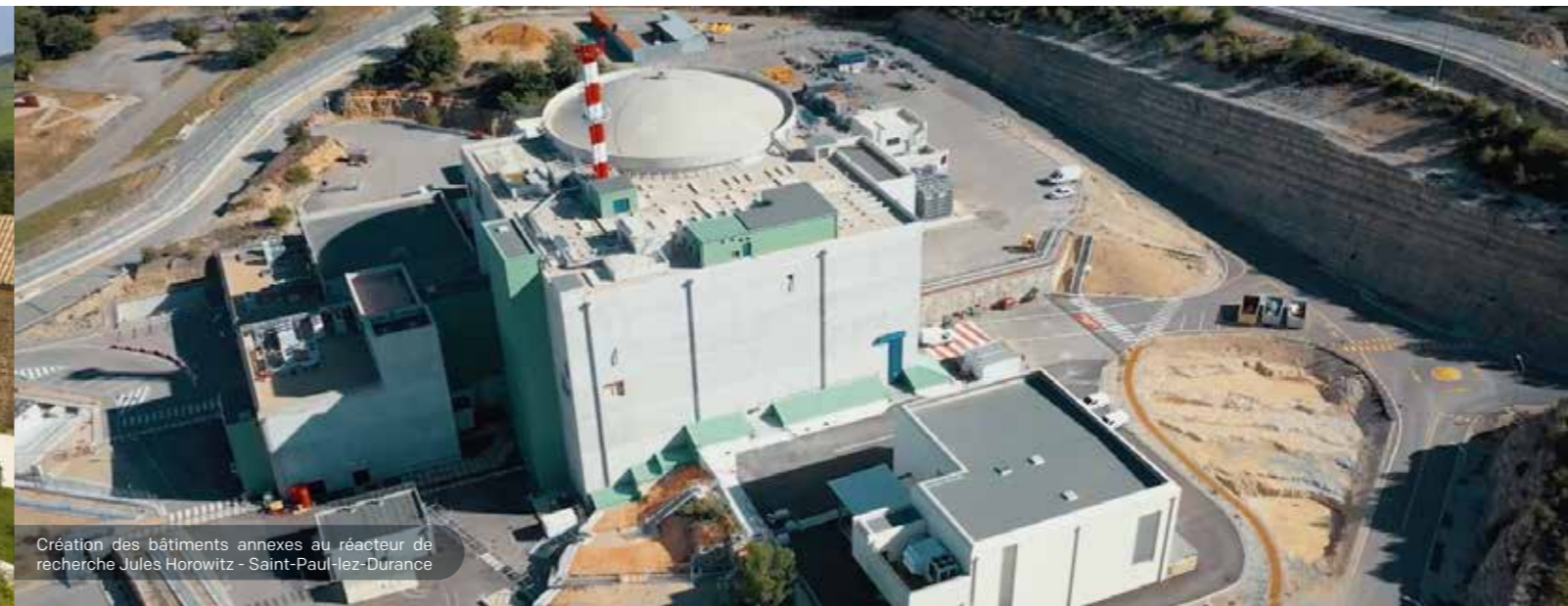
Création des bâtiments annexes au réacteur de recherche Jules Horowitz - Saint-Paul-lez-Durance