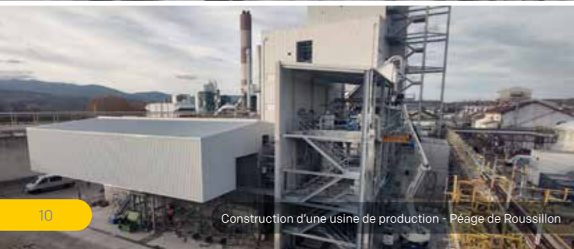
Construction d'une usine de production - Péage de Roussillon