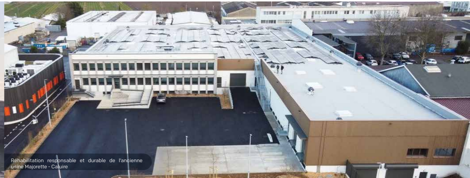
Réhabilitation responsable et durable de l'ancienne usine Majorette - Caluire