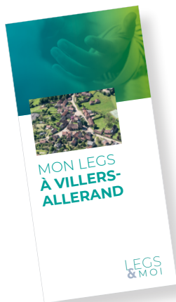
Plaquette legs et donations