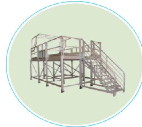
Moyens d'accès et plateformes