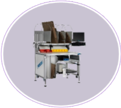
Postes de travail et mobilier techniques