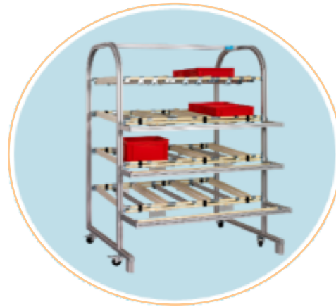
Chariots et moyens de manutention