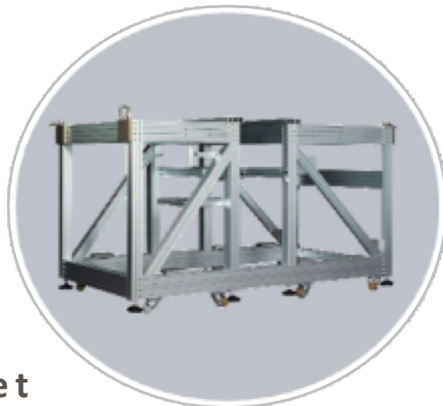
Structures et cartérisations